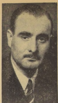
Diputado Hernán Brucher

OTRAS SESIONES.— La Cámara celebrará hoy dos sesiones especiales. De 11 a 13 horas, para continuar el debate sobre los problemas de la Gran Minería, y de 20 a 21 y 22 a 23 horas, para tratar el problema de la Industria Azucarera Nacional (IANSA).