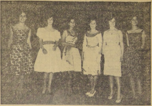
VILLA DEL MAR.— El Liceo de Niñas de Villa del Mar prepara con entusiasmo los festejos de su cincuentenario...