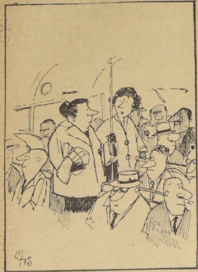
Tanto alegamos por asientos en el Parlamento, que perdimos los asientos de los micros...