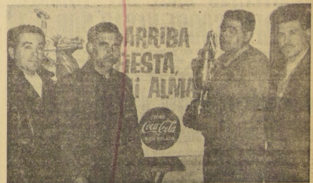
● EN LA COMPAÑIA DE CONSUMIDORES DE GAS de Santiago, dirigentes del Club de la Empresa reciben la Copa Coca-Cola, disputada en un interesante torneo de baby-fútbol.