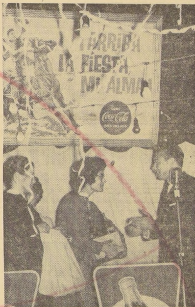
● EN EL SINDICATO INDUSTRIAL VESTEX se entregaron los premios a los vencedores de las diversas competencias de celebración de Fiestas Patrias.