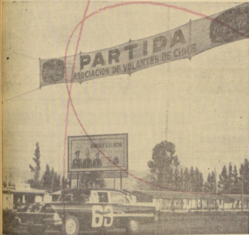
● EN NOS se dio la largada al Gran Premio de Regularidad Automovilística 1961, Nos-Parral-Catillo.