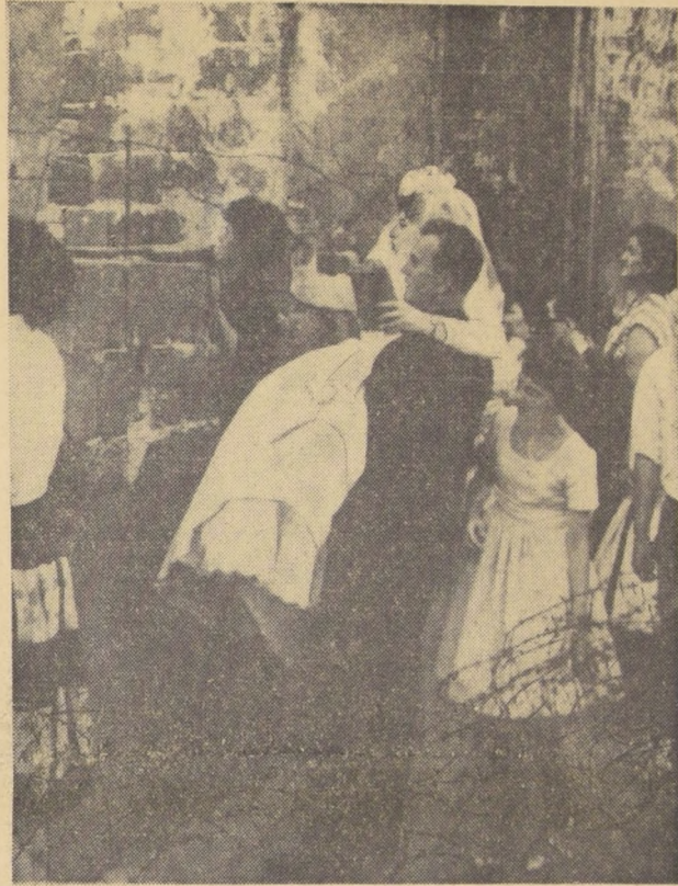
BERLIN.— La boda tuvo lugar en el Berlín occidental. La familia de la novia que vive en el Berlín oriental, tras la pared comunista, no pudo asistir a la ceremonia. En vista de la cual todos se encontraron al lado de la pared que divide la triste ciudad. El novio levanta a la novia a fin de que pueda ver a su madre.