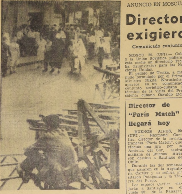
ARGELIA.— Las famosas tiendas árabes de esta ciudad fueron desmanteladas y los cabalotes quedaron al desnudo, cuando los comerciantes árabes resolvieron cerrar sus negocios en protesta por los residentes alienados de que fueron víctimas de parte de los residentes europeos.