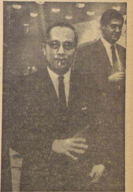
NACIONES UNIDAS.— Puede verse aquí, en primer término, al representante de Bermudas en la NU, abandonando la Asamblea General. Es mencionado como otro de los serios aspirantes a reemplazar en el cargo de Secretario General del organismo mundial, en carácter de interino, al trágicamente fallecido Dag Hammarskjöld.