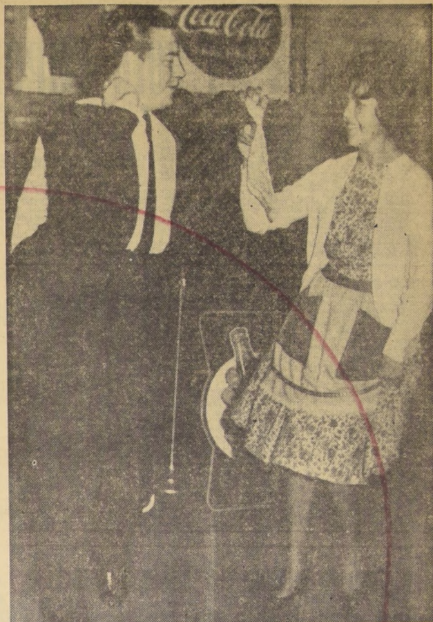
● EN EL LICEO FRANCÉS se realizó un simpático y animado baile, y en él nuestra típica cueca tuvo entusiastas intérpretes.