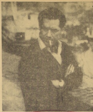
LAUTARO MURUA: Grandes éxitos, pero afuera.

Lautaro Murua está sufriendo en Argentina algo parecido a lo que les ocurre a otros directores chilenos. El hecho de que sus dos películas no hayan sido consideradas por el Instituto Cinematográfico Argentino — criticado por los propios especialistas argentinos, como Burone — habla claramente de las limitaciones que encuentra la gente que tiene espíritu renovador, no sólo aquí, sino también en otras latitudes. Algo anda mal. Debe ser aquello de los "vicios tradicionales" de que habla Burone en su crítica. Es muy probable que las dos películas de Murua sean estrenadas antes de fin de año en Santiago.