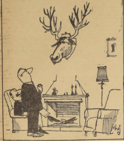
En esos países si que debe valer la pena "un cachito de chicha".