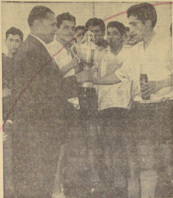
● EN SAN MIGUEL, el capitán del equipo Santa Ana, de esa comuna, recibe la Copa Coca-Cola, luego de ganar el torneo de Fiestas Patrias.