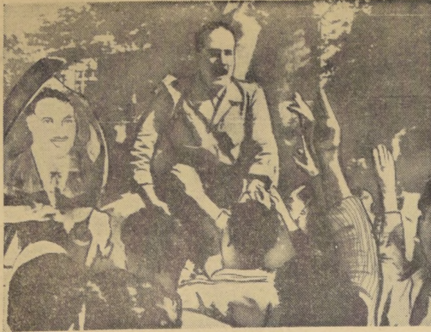
DAMASCO. — Un sargento de las Fuerzas Armadas sirias que se rebelaron contra el Presidente de la RFAU, Gamal Abdel Nasser, es conducido en hombros por la multitud en esta capital. La escena se produjo el jueves pasado.

BRASILIA, 2 (UPI).— El ex ministro de Marina Silvio José y el almirante Acir Dias fueron puestos hoy en detención disciplinaria, según órdenes del Primer Ministro Tancredino Neves por declaraciones políticas.