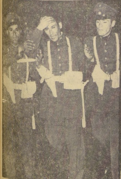
CARABINERO HERIDO — Un policía herido en la frente por una pedrada es socorrido por sus compañeros en los incidentes acaecidos en la madrugada. — Otros diez carabineros fueron lesionados por los hampones y elementos descontrolados que durante cinco horas promovieron graves desórdenes.

Hampones y elementos descontrolados crearon clima de violencia en el centro de la capital. — Veinte negocios dañados, vejámenes a mujeres, destrozos y agresiones a la policía