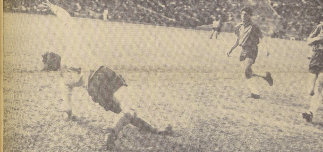
UNA ESCENA DEL SEGUNDO GOL uruguayo, conseguido en el suceso, no alcanza a interceptar el balón, que inexorablemente se irá a las redes. Con este tanto y el que más tarde, en el segundo tiempo, obtuvo Luis Cubillas, se estructuró el 3 a 2 con que Uruguay batió a la Selección Chilena