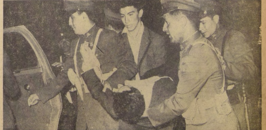
AUXILIO A UN LESIONADO. — Carabineros auxilian a un estudiante que fue agredido por elementos descontrolados en los incidentes que se iniciaron en la Plaza Vicuña Mackenna y que luego se extendieron a todo el centro de la capital. — Sólo un civil resultó herido en los disturbios, al ser víctima de un disparo hecho por un transeúnte que huyó.