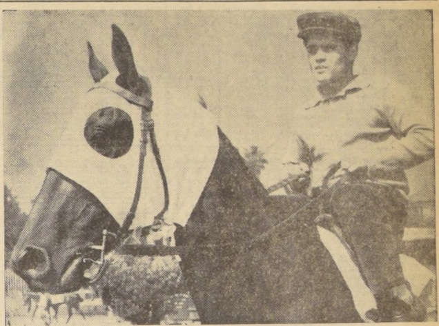
TESEO tiene una de las mejores opciones en el clásico del próximo domingo, en el Hipódromo Chile. En 1.800 metros puede venir de una hebra.

Ahora el panorama ha cambiado mucho y tenemos la impresión que cualquiera que gane esta competencia del domingo, reafirmará su opción a pelársela a Miss Therese en el Gran Premio, pero con el antecedente de que fue tan contundente la actuación de la gran invitada en El Ensayo, que resultará muy difícil dar otro pronóstico.