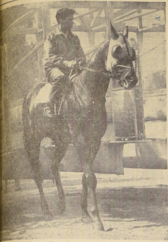
El caballo se mostró muy tranquilo cuando al inicio al Hipódromo Chile. Lo vemos sereno en el momento de salir a correr.