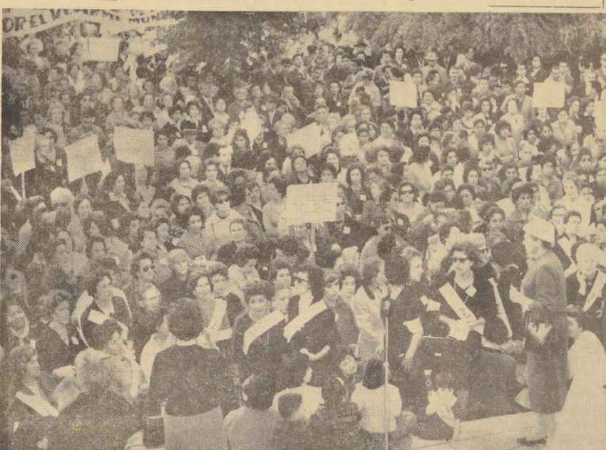
Miles de mujeres santiaguinas participaron ayer en la primera demostración pública contra las pruebas nucleares...

Movimiento femenino por la paz universal