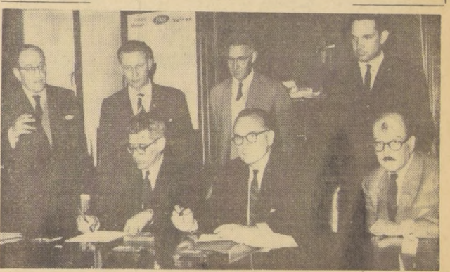
Con asistencia de representantes del Punto IV, CORFO, CORVI y de la Sociedad Constructora de Establecimientos Hospitalarios...