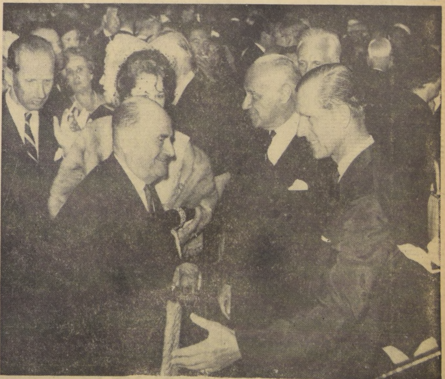
Un acontecimiento social y diplomático constituyó la recepción ofrecida en la tarde de ayer en la sede de la Embajada de Gran Bretaña, en honor del Príncipe Felipe, Duque de Edimburgo, acto que realizó con su presencia el Príncipe de Gales.