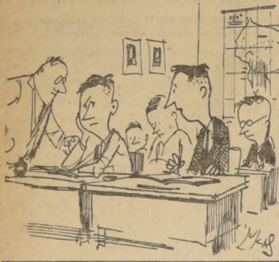
No te amargues viejo... Ya llegará alguna huelga de profesores...