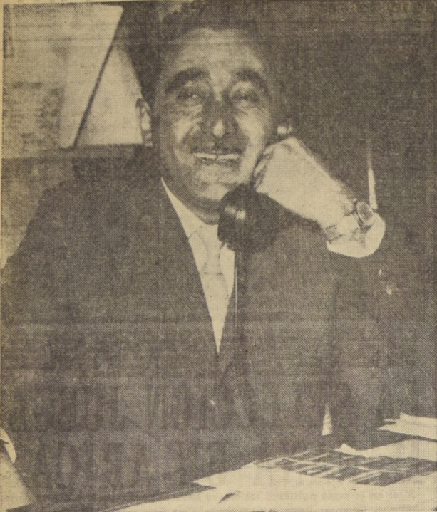
Chito Morales, el original y aplaudido humorista que siempre está de moda, y que actuara hoy en el show artístico que ofrece LA NACION a las 12 horas, con motivo del Primer Sorteo Semanal de la Polla DEL MUNDIAL DE FUTBOL.