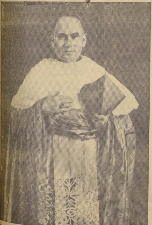
Monseñor Raúl Silva Henríquez, Arzobispo de Santiago y segundo Cardenal de Chile, quien llegará hoy de regreso de Roma, donde recibió la birreta cardenalicia.