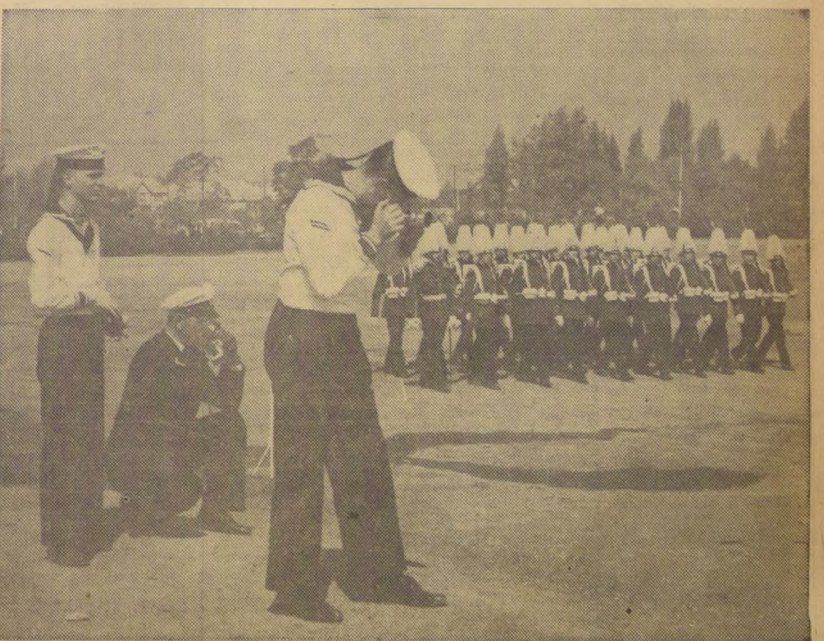
Un centenar de oficiales y cadetes de las fragatas alemanas "Hipper" y "Graf Spee", visitaron ayer la Escuela Militar para tomar contacto con sus colegas del Ejército chileno y participar en un almuerzo de camaradería que ratificó los lazos de amistad entre ambos países. En la foto, marinos alemanes captan fotografías del paso de una compañía de la Escuela Militar que, en su traje de parada de típico corte prusiano, desfiló en honor de los visitantes.