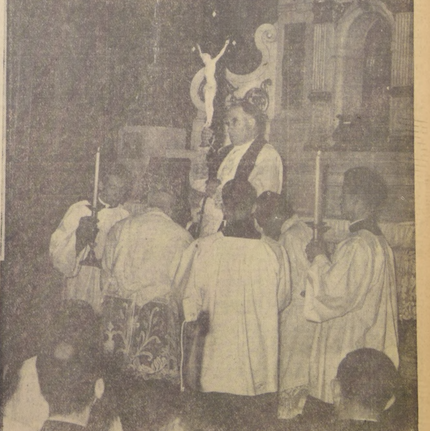
Ante la mirada fervorosa de los fieles, el Cardenal Silva levanta la imagen del Crucificado en el momento solemne de la Adoración de la Santa Cruz, en la Iglesia Metropolitana. La solemne ceremonia constituyó la culminación de los ritos con que el mundo católico expresó su desolación y duelo por la muerte del Salvador. El Cardenal presidió, como ayer, todas las ceremonias de hoy y de mañana. (Amplias informaciones de Semana Santa en página 2.)