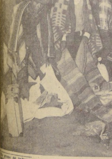
Un grupo de indios bolivianos muestra sus artesanías a un cabo de la Tenencia de Chapiquiña, con el objeto de conseguir que no lleva armas. El grupo de indios que se dirige a la frontera con Bolivia a pie, media hora después fue enviado a su destino en camión.

Chile: Dijo que es "uno de los tres grandes países" de Latinoamérica.