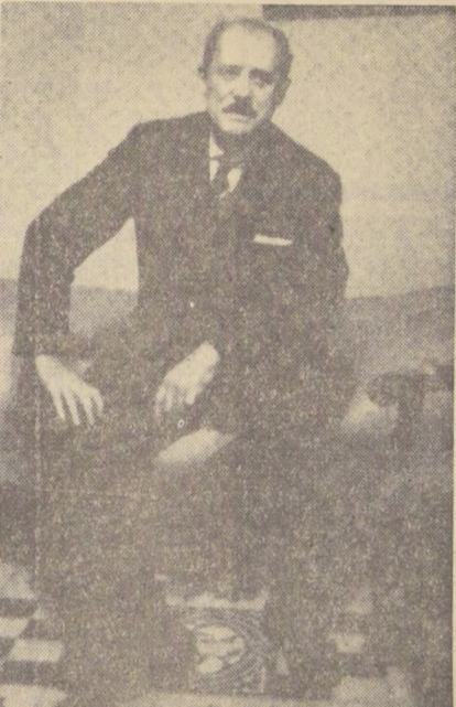
La captura del ex general Raoul Salan, comandante en jefe de la Organización del Ejército Secreto que lucha por mantener a Argelia bajo la dominación francesa marcó otro hito en la historia de ese territorio nortáfricano. Salan estaba prófugo desde que fuera procesado por su alzamiento contra De Gaulle, y cuando fue arrestado su aspecto había cambiado mucho: se había teñido el pelo, usaba espeso bigote y habría sido difícil reconocerlo a primera vista. A la izquierda se ve a Salan en uniforme del Ejército francés, y a la derecha, con su nueva fisonomía; según una fotografía de "Life".