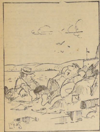
No...! Aquí no pasa nada... Somos los ingleses de la América del Sur...