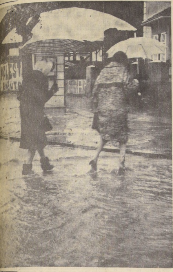
El fuerte temporal de lluvia y viento, que azota al país desde hace 48 horas, en la zona comprendida entre Santiago y Puerto Montt ha dejado como saldo cuantiosos daños. La inclemencia climática ha mantenido paralizados algunos trenes, por largas horas, ha cortado vías terrestres, y, por último, la infatigable secuela de inundaciones en las poblaciones populares, con la consiguiente evacuación de grupos familiares.