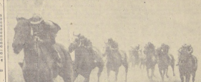
RIO APURE se sintió muy cómodo en la pista que tenía el Club Hípico ayer. Por 3 cuerpos aventajó a Dominado. Más atrás, Vera Cruz y Americanista. Para los 1.200 metros, Rio Apure señaló 1 minuto 19 segundos.