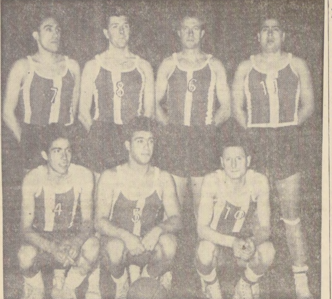
DEBUTO GANANDO.— Con facilidad triunfó Palestino en la jornada inaugural de la competencia capitalina. Sin mayores problemas doblegó a Quinta Normal Unido por un score que refleja la superioridad que mostró en la cancha, 58-40. En el grabado, el equipo de colonia para esta temporada.