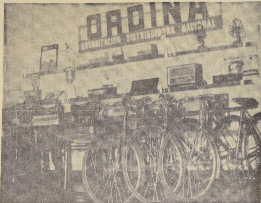
Esta foto corresponde a un sector del almacén de ventas de la Organización Distribuidora Nacional, "ORDINA", cuya generosa participación en la Polka del Mundial de Fútbol...