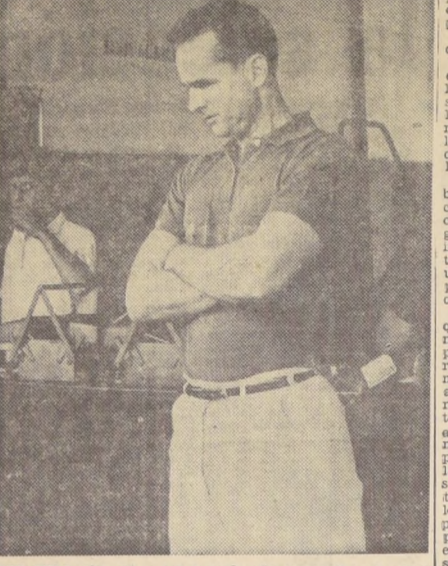
PHIL HILL, otra vez, y por segundo año consecutivo, el actual Campeón Mundial de Automovilismo inscribió su nombre como vencedor haciendo pareja con el belga Olivier Gendebien, en las famosas "24 Horas de Le Mans".