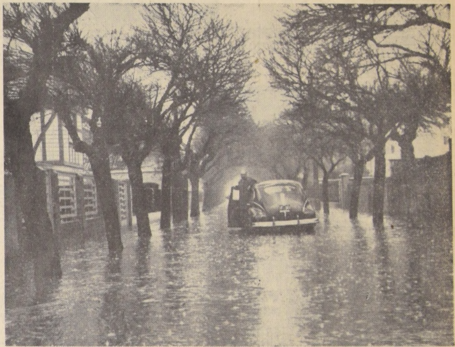
La calle Magdalena, en la comuna de Providencia, quedó convertida en un verdadero río a causa del fuerte temporal de lluvia que azotó a Santiago durante todo el día de ayer. En el grabado, un conductor de un auto, no halla la forma de solucionar el problema que le significa el salir de su coche sin tener que afrontar la corriente de agua que se formó en esta calle, después de la intensa lluvia que la convirtió prácticamente en un río.

El fuerte temporal de lluvia y viento, que azota al país desde hace 48 horas, en la zona comprendida entre Santiago y Puerto Montt ha dejado como saldo cuantiosos daños. La inclemencia climática ha mantenido paralizados algunos trenes, por largas horas, ha cortado vías terrestres, y, por último, la infatigable secuela de inundaciones en las poblaciones populares, con la consiguiente evacuación de grupos familiares.