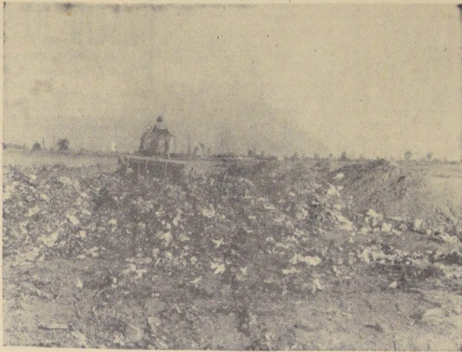
RELLENO SANITARIO.— Una de las soluciones que las Municipalidades del país están buscando al problema de la basura, es el relleno sanitario, el cual cuenta con la aprobación del SNS. Una de las primeras en acordar poner en práctica este método, ha sido la Municipalidad de Nuñoa, que lo utilizará en los terrenos adquiridos para este efecto en las Lomas de Maquil.