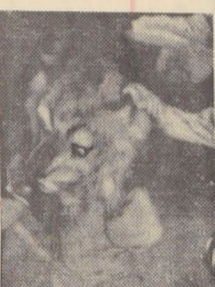
Figura del "león" que se robó en el teatro Caupolicán.