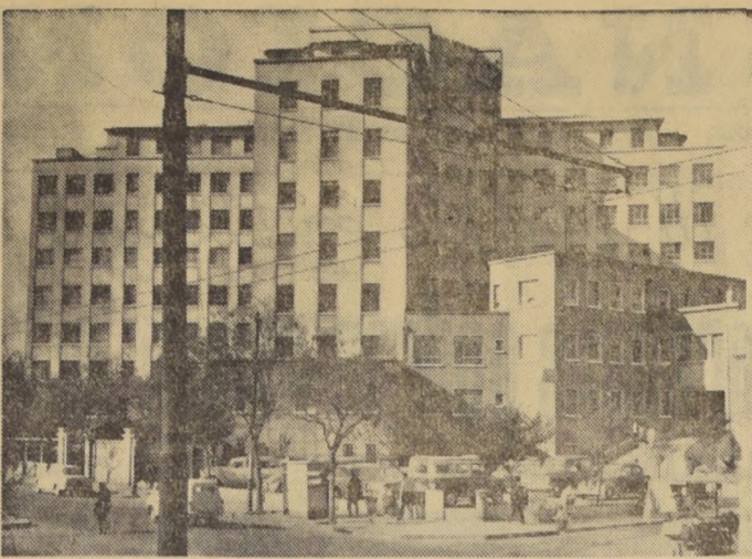
EL HOSPITAL SAN JUAN DE DIOS.—El Hospital "San Juan de Dios" es el más antiguo establecimiento hospitalario dependiente del Servicio Nacional de Salud que hoy celebra el décimo aniversario de su creación. EN EL GRABADO, un aspecto de la moderna construcción del establecimiento, que funciona en Huérfanos esquina de Matucana.

Las condiciones del préstamo son: 27 años plazo, 1,14 por ciento de interés anual y cuotas anuales que empezarán a pagarse un año después de la firma del contrato.