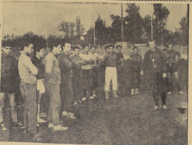
UNIVERSIDAD TECNICA, equipo puntero e invitado del torneo de ascenso...