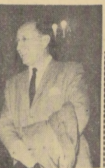
JOVINO NOVOA: presidente de Colo Colo...