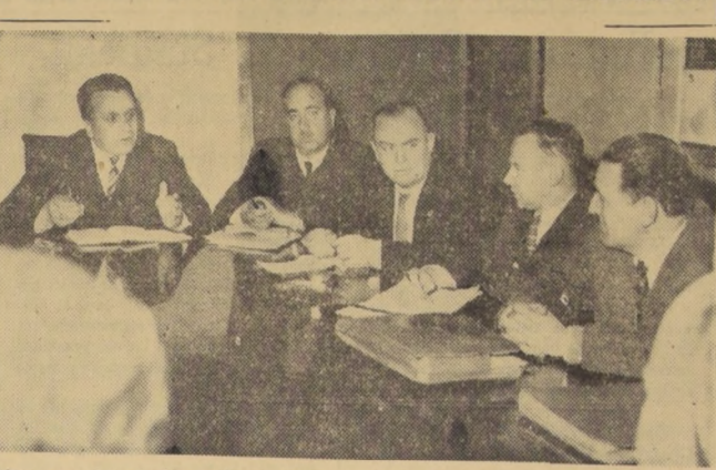
Balance completo de los problemas agrícolas y solución a los mismos será el resultado final de la concentración de Directores Zonales que empezó ayer en el Ministerio de Agricultura...