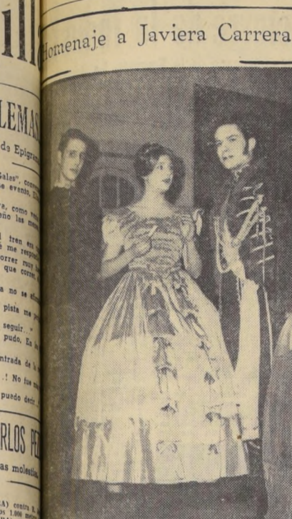
Homenaje a Javiera Carrera