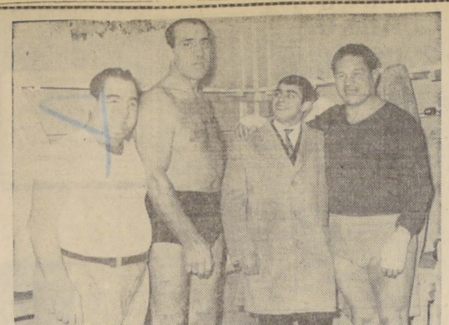
PRIMO CARNERA Y Arturo Godoy volverán a calzarse guantes para enfrentarse en el ring. El peso pesado chileno desafió al ex campeón del mundo, luego de que este lo venció el sábado pasado en un match de lucha libre. En medio de ambos gigantes, está Domingo Rubio, promesa vigente del boxeo chileno. En el extremo izquierdo, Bonin, el popular masajista italiano.