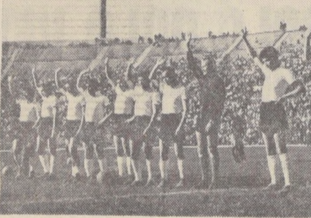
UN TRIUNFO OPACO logró el cuadro de Colo Colo frente a Rangers por tres goles a cero. Las cifras logradas no indican una recuperación en el juego de los albos. Fueron consecutivas, más que por producto de acciones bien orientadas, por suerte y por errores de la defensa sureña. La ausencia de un técnico que oriente el juego colocolino se puede apreciar en forma clara en el accionar incoherente que mostró Colo Colo.