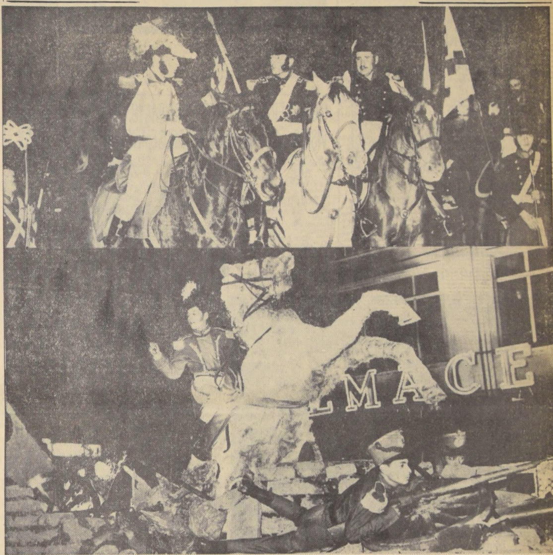
Los dos actos de la vida del Padre de la Patria: el abrazo de Maipú, al encontrarse, herido, con el General San Martín, y la batalla de Rancagua, fueron presentados con notable realismo en el desfile histórico que durante 180 minutos arrancó aplausos del numeroso público...

Dos fases de la gloriosa jornada: Maipú y Rancagua