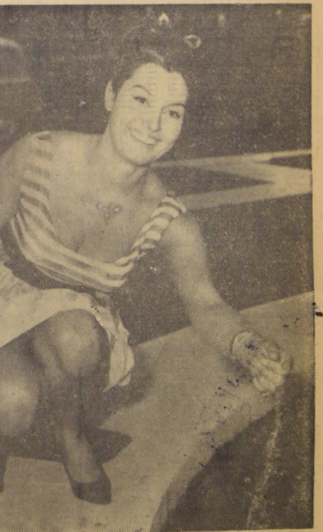
LCNDRES.— La actriz italiana Rosanna Schiavino demuestra su encanto, al jugar con el agua de la piscina exterior del Hotel Dorchester de Londres. La bella reina del cine firma en esa capital la producción de Carl Foreman, llamada “Los Victoriosos”, en compañía de Vince Edwards.