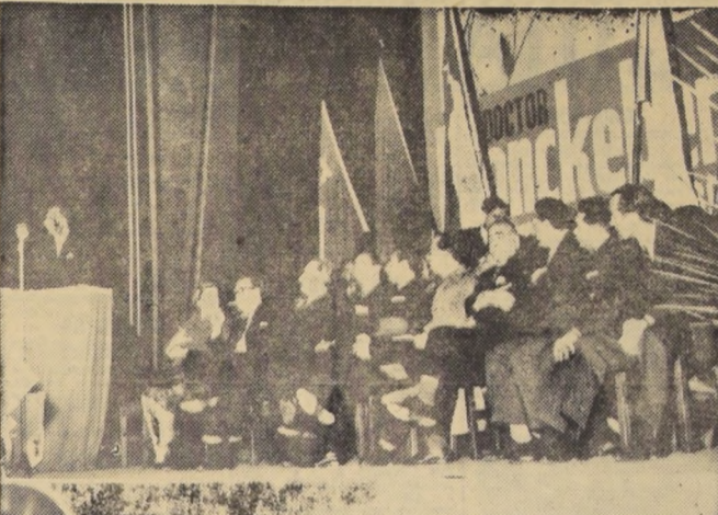
MONCKEBERG EN EL BAQUEDANO. — Impresionante demostración de fuerza, unidad y entusiasmo, dieron anoche los gremios, los diversos partidos políticos, que integran el Frente Democrático.