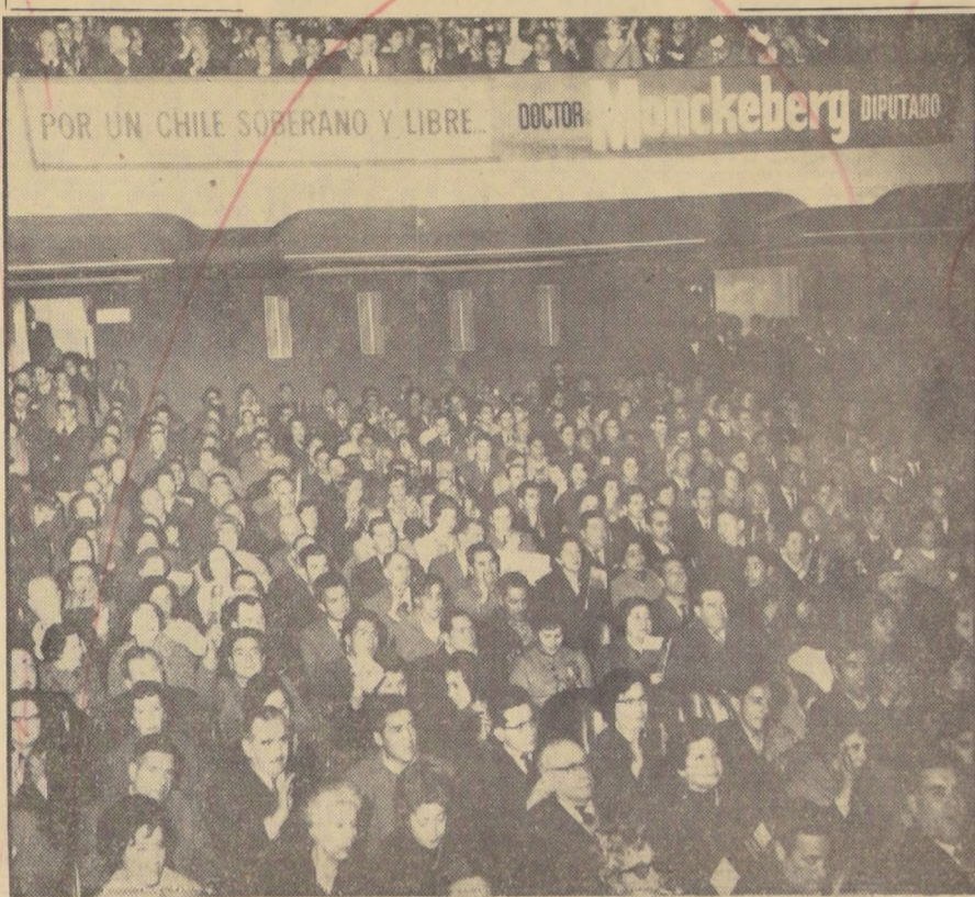
Elocuente demostración del poderío de las fuerzas gremiales que apoyan la candidatura del doctor Gustavo Monckeberg, fue la proclamación efectuada anoche en el Teatro Baquedano. Trabajadores de todos los sectores se congregaron allí para evacionar al abanderado del Frente Democrático. El grabado abarca comentarios sobre la numerosa concurrencia. Notense las puertas del fondo, por las que los partidarios del doctor Monckeberg pugnan por entrar a la sala.