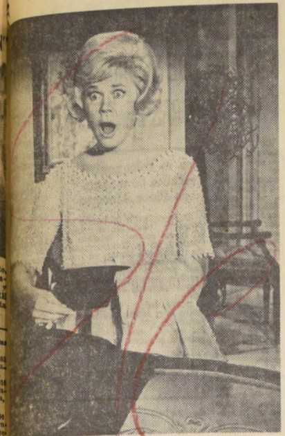
Day, la fascinante actriz de Universal, se presenta en "LIVE AMOR MIO", la película que...