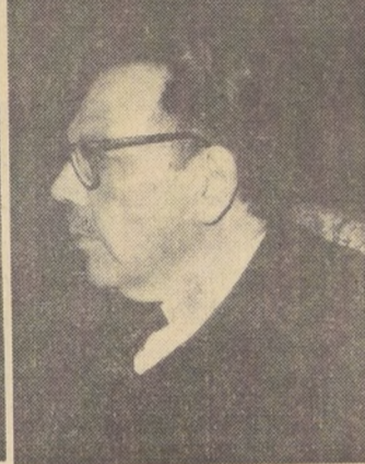
Ministro del Interior, Dr. Sótero del Río G.