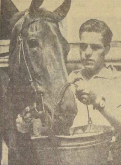
MONGRANA tuvo mala suerte en el Gran Premio y ahora espera desquitarse en "Las Ocas".

Maestro Pepe, 800 metros en 50 segundos. El caballo de la imagen ganó la carrera.