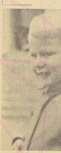
BRUSELAS.— Esta simpática expresión corresponde a una de las muchas fotografías que se tomaron del Príncipe Philip, hijo del Príncipe Albert y la Princesa Paola, en el día de su tercer cumpleaños. El pequeño Príncipe está en el jardín del Palacio Real de Bruselas.