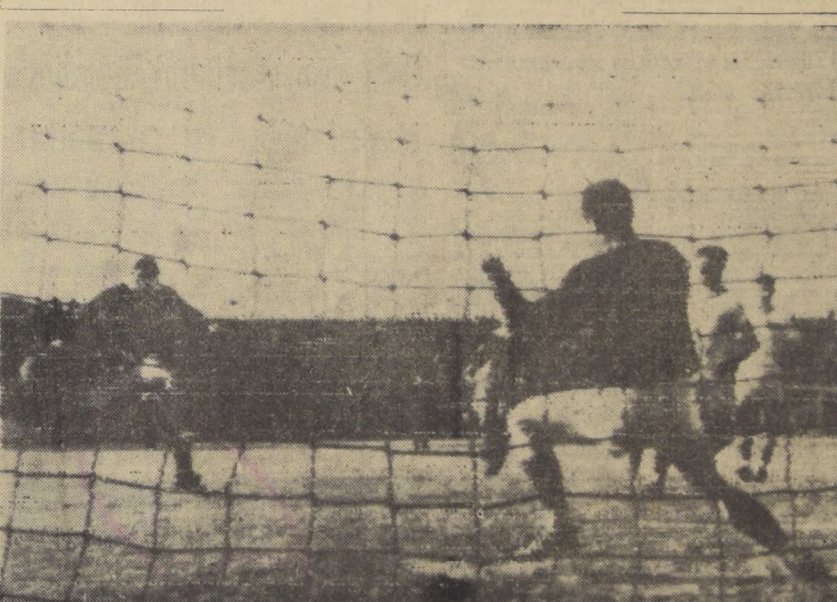
TEL AVIV, Israel. — El arquero de la selección de fútbol de Israel hace una tentativa de atajada, pero el lanzamiento va desviado, ante un delantero de Universidad de Chile, en el encuentro que protagonizaron aquí el 30. Israel ganó por uno a cero, tanto señalado en la mitad del primer tiempo. Fue esta la primera derrota del equipo campeón chileno en su actual gira por Europa y el Medio Oriente.