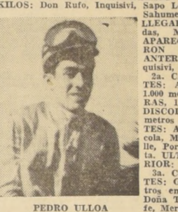
PEDRO ULLOA La caza.

1.ª CARRERA - EJEMPLARES QUE DESCARGAN KILOS: Don Rulo, Inquisivi, Sapo Loco, Mudas, Musset, Sahumerio, VIENEN DE LLEGAR PENULTIMO: Mudas, Musset, Yapeyú. REAPARECE: Yapeyú. FUERON SEGUNDOS EN SU ANTERIOR: Imposible, Inquisivi, Sapo Loco.