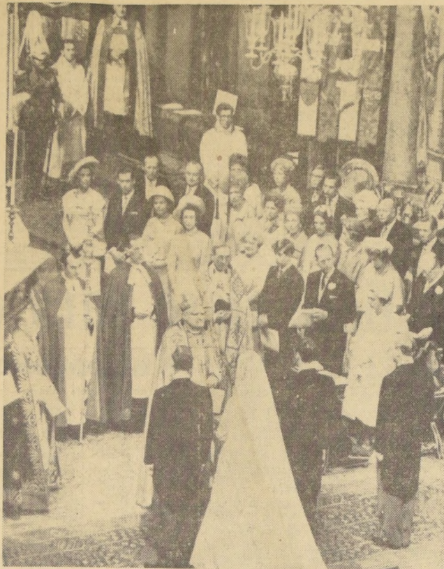
LONDRES.— En la Abadía de Westminster se celebró la boda de la Princesa Alejandra, 12 en la lista de sucesión al trono de Gran Bretaña, con el hombre de negocios escocés Angus Ogilvy, de 34 años. El Arzobispo de Canterbury bendijo el matrimonio. Más de ciento veinte miembros de la realeza asistieron a la ceremonia.