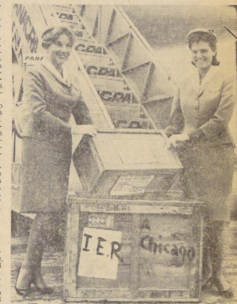
Por el Interamericano de Panamá viajaron ayer, con destino a la Feria Internacional de Chicago, Estados Unidos, dos cajones con diversas muestras de artesanía chilena...