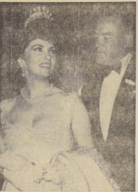
NUEVA YORK.— El comediante Bob Hope parece tener algo en vista, mientras conversa con la actriz italiana Gina Lollobrigida...