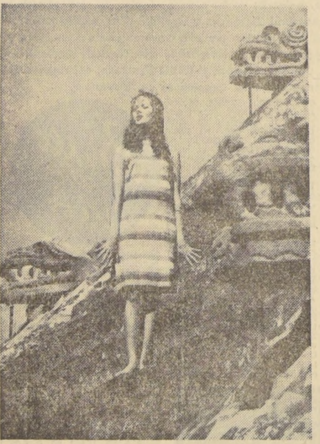
MEXICO.— Para recordar el esplendor azteca, esta joven ataviada con vestido moderno que lleva los colores del imperio...