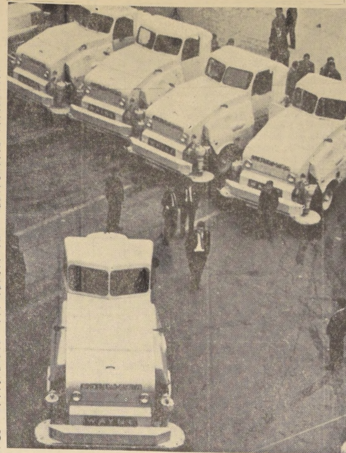
Cinco nuevas barredoras Wayne modelo 2-770, de moderna estructura y consideradas como un positivo avance en esta clase de labores...