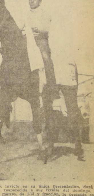
PAR DE ASES, invicto en su única presentación, dará el handicap de la reaparecida a sus rivales del domingo. Su cotejo, en 1.200 metros, de 1.13 y fracción, lo presenta como carta de primer orden.