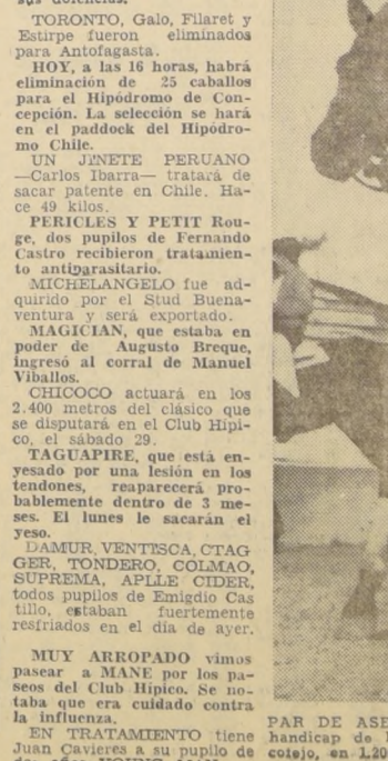
PAR DE ASES, invicto en su única presentación, dará el handicap de la reaparecida a sus rivales del domingo. Su cotejo, en 1.200 metros, de 1.13 y fracción, lo presenta como carta de primer orden.

FOCOCO, este elemento correrá el próximo domingo en la Ciudad-Jardín.