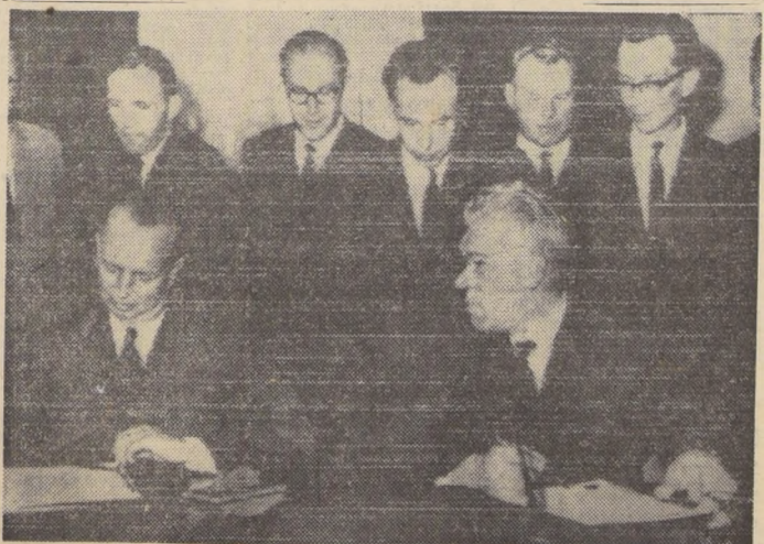
GINEBRA. -- El Embajador de Estados Unidos, Charles Stelle (izquierda), y el Embajador soviético, Semyon Tsarapkin, firman un acuerdo mediante el cual se establecerá una línea directa de comunicación entre Washington y Moscú. El objetivo de ese contacto instantáneo es el evitar una guerra por accidente.