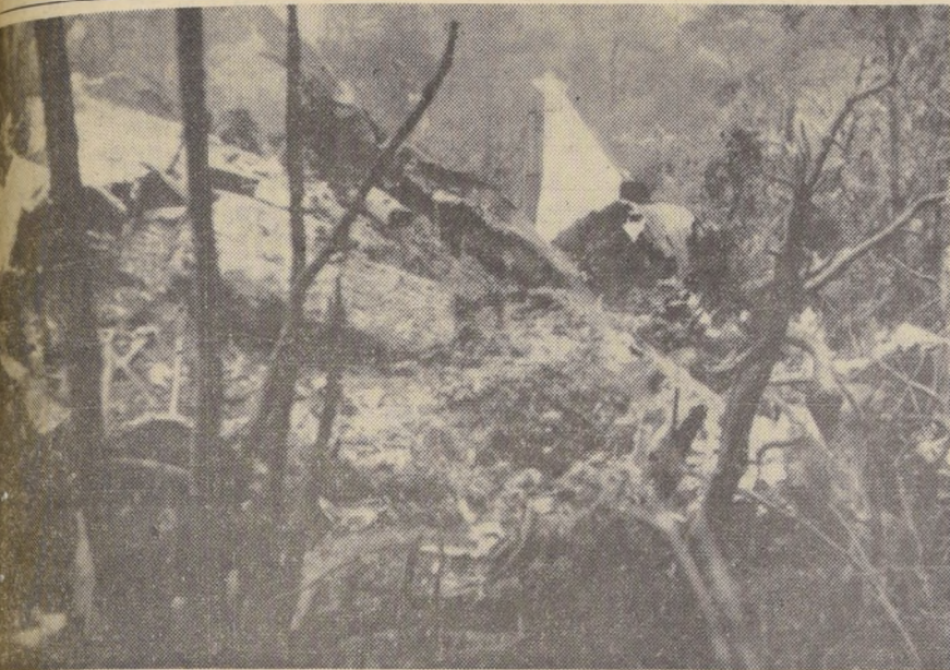
Los restos destruidos del FACH 953 aparecen en el grabado esparcidos en la zona boscosa donde cayó, pereciendo 19 personas y salvando milagrosamente uno de los pasajeros civiles que llevaba a bordo. Solo se puede ver con cierta nitidez la mitad del timón intacta. El resto del fuselaje quedó diseminado por los alrededores del cerro donde se produjo el impacto. (PASA A LA PAGINA 16)

CIUDAD DEL VATICANO, 20 (UPI).— El Sacro Colegio Cardenalicio votó hoy cuatro veces para elegir al sucesor del Papa Juan XXIII. Pero al término de la jornada no había logrado dar mayoría necesaria de dos tercios a ninguno de los candidatos y el trono de San Pedro continuaba vacante. Los ochenta Príncipes de la Iglesia reunidos en la Capilla Sixtina, votaron dos veces por la mañana y otras dos veces por la tarde. Pero en ambas ocasiones la columna de humo negro que se elevó de la chimenea especial instalada en el Palacio del Vaticano indicó que no había acuerdo, dando impulso a las conjeturas de que el Sacro Colegio, en ausencia de un claro favorito, se inclinará por un "Papa de transición".