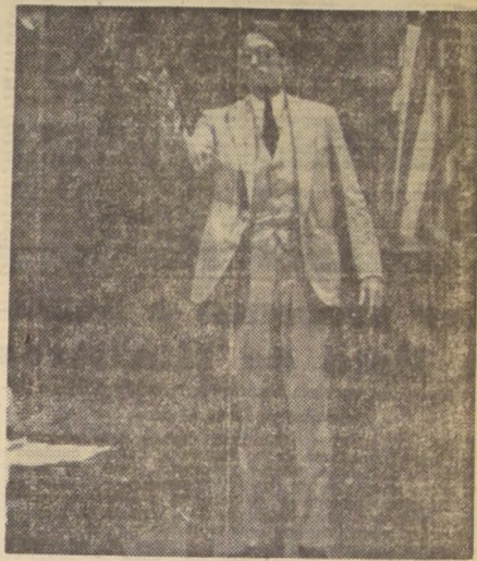
GREGORY PECK, ganador del "Oscar" por su brillante actuación en "MATAR UN RUISEÑOR".

Ahora, avisamos a nuestros estimados lectores que, en definitiva, el sorteo se efectuará en las oficinas de LA NACION, mañana sábado, a las 11.30 horas, aunque llueva, truene o relampaguee. Todo el mundo sabe que se sortean, primero, $ 100, 20, veinte premios de objetos seleccionados en la línea fina de cosméticos por Artez Westerley; 30, cincuenta vales por dos plateas cada uno, y 10 obsequios de la tradicional casa de artículos de lujo para caballeros, de Estado 158, Casa "Saxony".