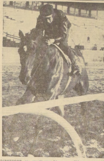
DIRETTORE, que venció muy bien en su última presentación, es como la sorpresa precisa para dar cuenta de los favoritos...