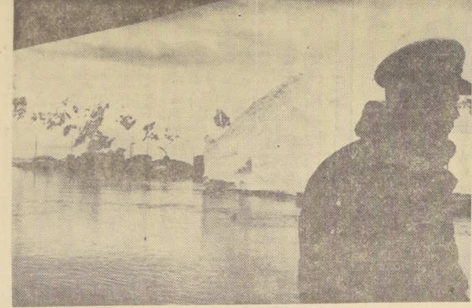
La Base "Gabriel González Videla", en la Antártida chilena, vista desde la cubierta del "Piloto Pardo". Todas las bases de los países instaladas en la Antártida celebran hoy la noche más larga del Polo Sur, en que por 24 horas no se ve el sol.

trabajos en el terreno mismo, en las bases norteamericanas", — anuncia el señor Pinochet, y agrega: "Es de esperar que en la juventud chilena se despierte el entusiasmo antártico, pues es el continente del futuro, el continente de ellos".