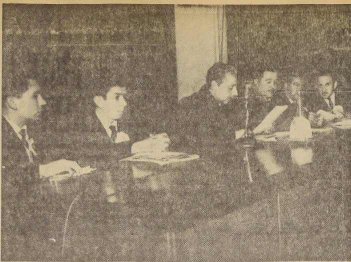
Ayer, en el Teatro de Obras Públicas, fue inaugurado el Congreso de Personales de Empresas Periodísticas...