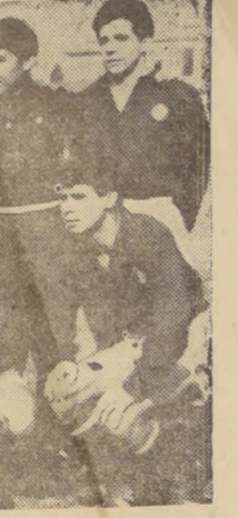
Ante Palestino buscará Audax Italiano rehabilitarse...