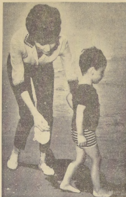
NOWSHAR, Irán.— Cuando un niño está de vacaciones en la playa, el deseo más fuerte es correr hacia las olas que mueren en la arena, orladas de espuma. El pequeño Príncipe Reza no es una excepción, aunque su madre, con carinosos celos, corrió tras él, hasta alcanzarlo y evitar que se mojará con tanta ropa. El príncipito hasta botó su pequeño sombrero blanco, en su rápida y fracasada fuga hacia el mar.