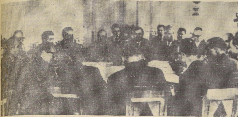
MOSCU.— Miembros de la delegación británica y soviética en las conversaciones sobre proscripción de las pruebas nucleares aparecen aquí mientras celebran su segunda sesión, ayer 16. En las conversaciones participaron el Subsecretario de Estado de Estados Unidos y enviado especial del Presidente Kennedy, Averell Harriman; el enviado británico, Lord Hailsham; el Ministro de Relaciones Exteriores, Andrei Gromyko, y el Viceministro de Relaciones Exteriores y a la vez representante soviético en Ginebra, Valerian Zorin.