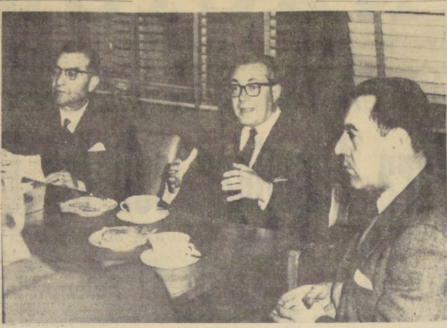
Hoy se reunirán en la Sala del Consejo de los CORFO, industriales de todas las ramas de la producción del país con el fin de preparar los preparativos de su participación en la 5a. Feria Internacional del Pacífico, que se inaugura el 26 de octubre en Lima.

Hoy se reunirán en la Sala del Consejo de los CORFO, industriales de todas las ramas de la producción del país con el fin de preparar los preparativos de su participación en la 5a. Feria Internacional del Pacífico, que se inaugura el 26 de octubre en Lima. En la reunión de mañana, se elaborará la lista definitiva de los industriales chilenos que enviarán sus productos a este torneo. Dicha lista debe ser enviada al Perú antes de fines de mes, con el fin de que los expositores puedan figurar en el catálogo general del torneo que circulará profusamente en todos los países participantes.