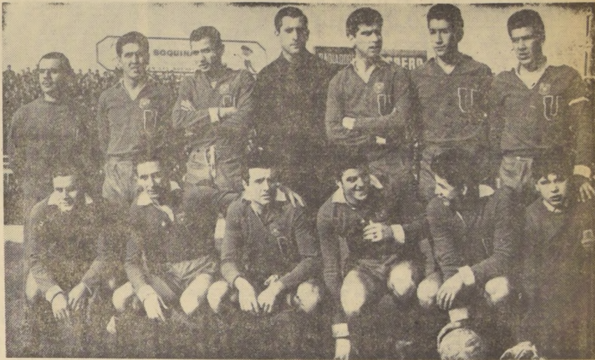
ES EL CAMPEON CHILENO.— El cuadro universitario, que ostenta el cetro máximo del balompié nacional, en la última temporada tiene la responsabilidad de enfrentar hoy, en el Estadio Nacional, al campeón paraguayo Olimpia...