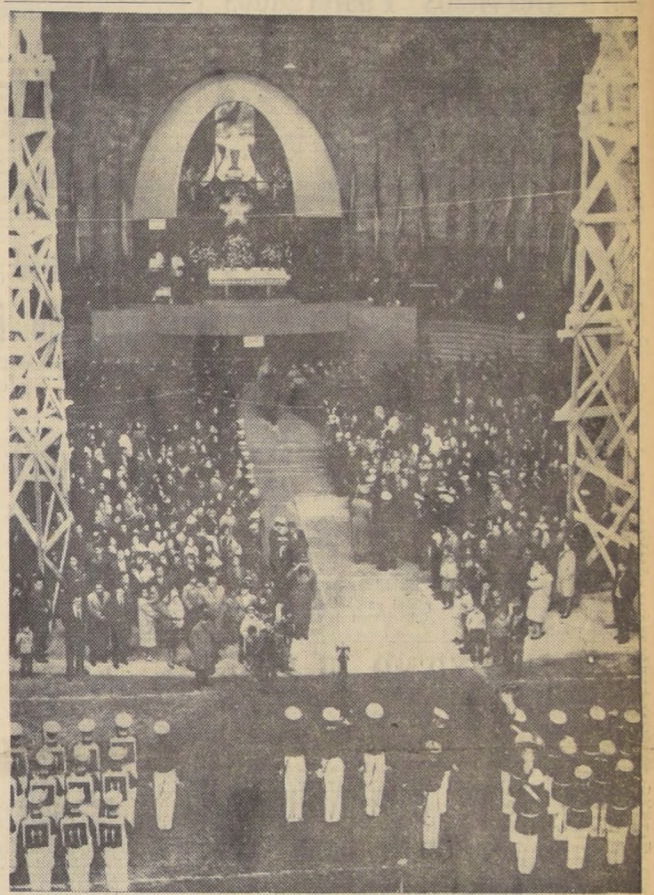
Este hermoso aspecto presentaba ayer el Templo Votivo de Maipú, cuando se hizo entrega del escapulario que el héroe Arturo Prat heredó de los cadetes de la Escuela Naval, INF. PAG. 3.