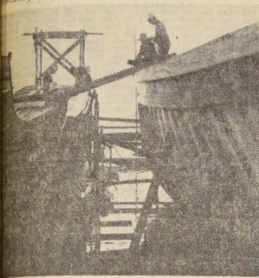
VALDIVIA.- CONSTRUCCION DE BARCOS.- Alumnos de la Escuela de la U. Técnica del Estado, en Valdivia, durante sus trabajos prácticos de construcción de barcos...