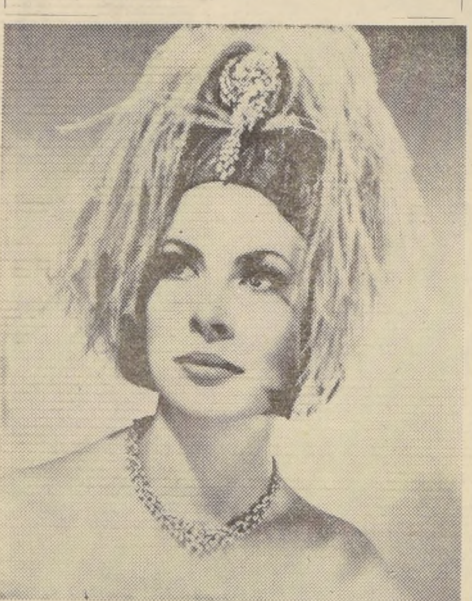
NEVA YORK.— La insaciable "moda" femenina no encuentra barrera suficientemente fuerte como para contenerla y los creadores han debido echar mano a la naturaleza para producir el "sauce llorón". Este modelito de sombrero, estimado como el nuevo estilo que se impondrá en esta temporada se llama "Sauce Llorón" y sirve de base a toda una línea, incluso de peinado y vestuario (femenino).