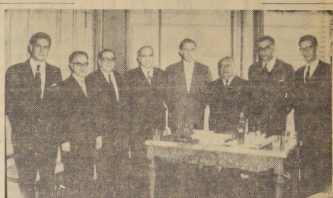
El Club Palestino se efectuó la comida ofrecida por el Embajador de la República Árabe Unida...