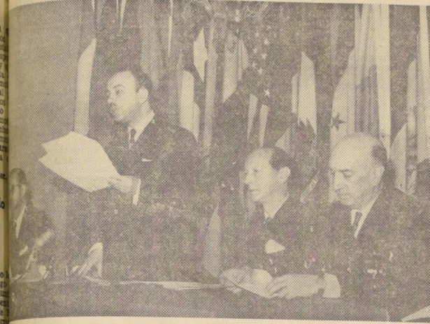
El Canciller, Carlos Martínez Sotomayor, al inaugurar ayer las Jornadas de Alianza para el Progreso, organizadas con motivo de cumplirse dos años de la firma de la Carta de Punta del Este.