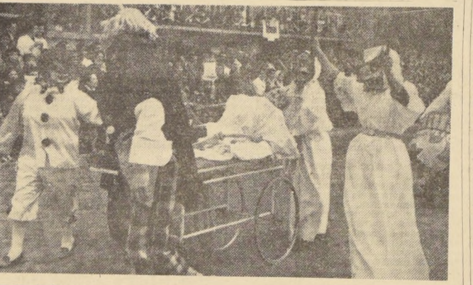
Con una tarde carnaval prosiguieron ayer los actos de celebración del 32.º aniversario de la Asociación de Empleados del Hospital José Joaquín Aguirre, en las canchas de fútbol y jardines del establecimiento. Al celebrarse este carnaval, con carros alegóricos y concurso de disfraces, se celebró el "Día del Hospital", departando empleados y enfermos en esta tarde de alegría. En el grabado, aparece una de las murgas llama...