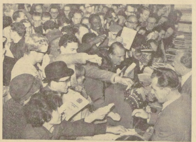
LONDRES.— Cientos de poco flemáticos británicos se apretaron para comprar, por un dólar y cinco centavos, la edición del proceso seguido por Lord Denning sobre el caso Profumo. En el grabado se ve a los interesados en adquirir el folleto, que se convirtió en lo que los conocedores llaman un "best seller", lo que equivale a decir el libro