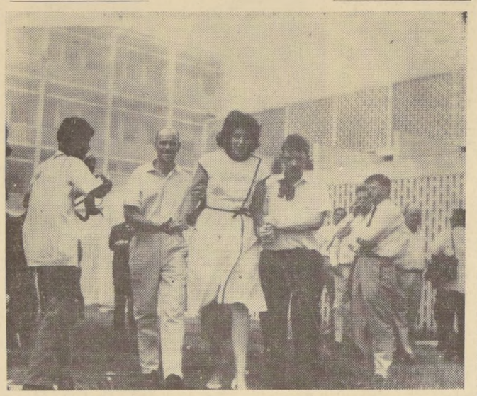
JAKARTA, Indonesia.— Miembros del personal de la Embajada británica, en esta capital, abandonan el edificio, incendiado por las turbas que protestaban por la creación del Estado de Malasia. En el grabado se ve a una mujer que es sostenida por dos hombres, uno de ellos con sangre en su camisa. El otro, muestra una herida en el rostro. Los incidentes ocurrieron después que Gran Bretaña dio su aprobación al surgimiento del nuevo Estado, que era rechazado por el Presidente Sukarno.