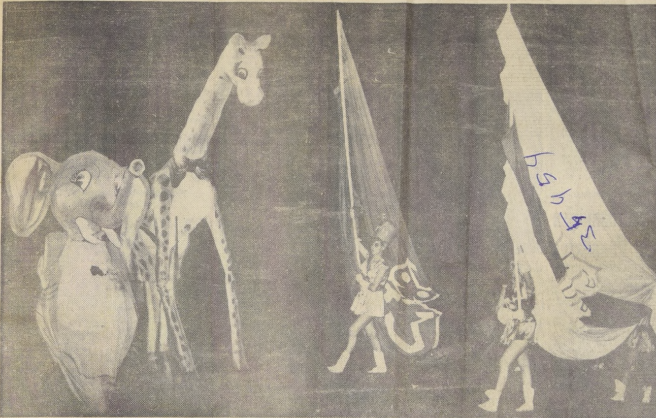
LA GIGANTESCA JIRAFÁ (izquierda) y la exposición de los emblemas de ambas Universidades fueron dos de los aspectos más espectaculares