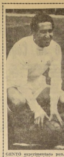
GENTO experimentado puntero de Real Madrid, autor del tanto del triunfo de España sobre Irlanda.