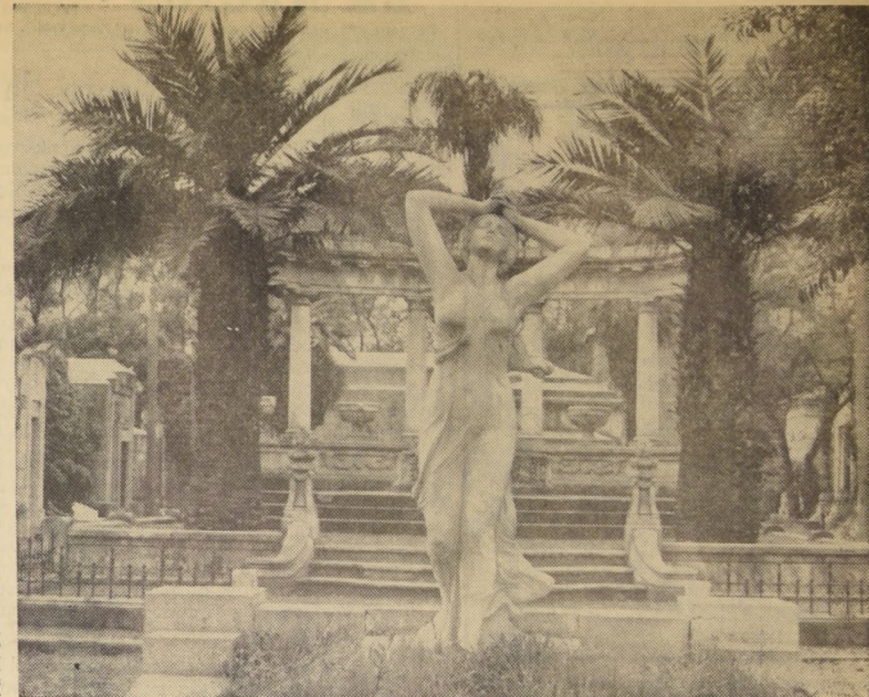
El Cementerio General guarda monumentos y esculturas como cualquier museo de arte. El buen gusto y las líneas modernas no están reñidos con la sobriedad y el sentimiento que deben inspirar la construcción de los mausoleos.

Este anfiteatro de siete pisos es el mausoleo acceso a ellos se facilita a lo largo de una rampa que lleva hasta la terraza, desde donde se obtiene una vista panorámica del Campesanto.