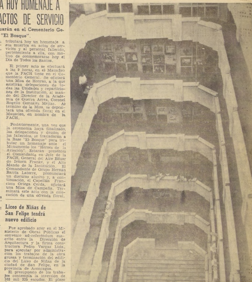
Este anfiteatro de siete pisos es el mausoleo acceso a ellos se facilita a lo largo de una rampa que lleva hasta la terraza, desde donde se obtiene una vista panorámica del Campesanto.