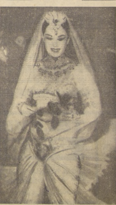
PARIS: La hija del actor Charlie Chaplin debutó en teatro como bailarina, encarnando el papel de princesa en el ballet "Centicienta", del compositor soviético Prokofiev.