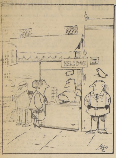
Me da un helado "Broiler"?