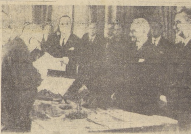
ROMA.—El Primer Ministro Aldo Moro (de recha) y el Presidente Antonio Segni (segundo desde la derecha) observan mientras el Vice Primer Ministro del nuevo Gobierno de centro izquierda, el socialista Pietro Nenni, procede a tomar juramento a los restantes Ministros. Al fondo se observan a los componentes del Gabinete.