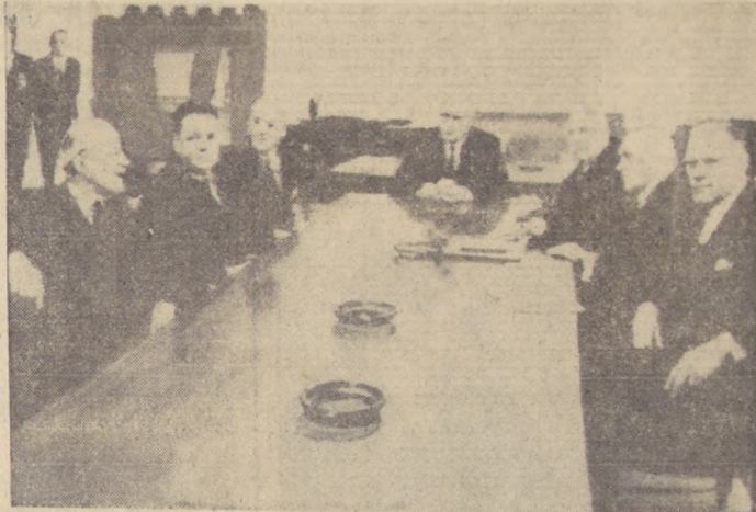
WASHINGTON DC.—Su primera sesión —destinada a constituirse— celebró la Comisión Investigadora Especial, designada por el Presidente Johnson, para que averigüe todos los pormenores del asesinato de su predecesor.

WASHINGTON, 5. (UPI).— (Por Jack Warren).— La "Comisión Warren" celebró hoy su primera sesión formal, bajo fuerte guardia policial, y acordó solicitar al Congreso la facultad de citar a testigos, obligándolos a comparecer ante ella.