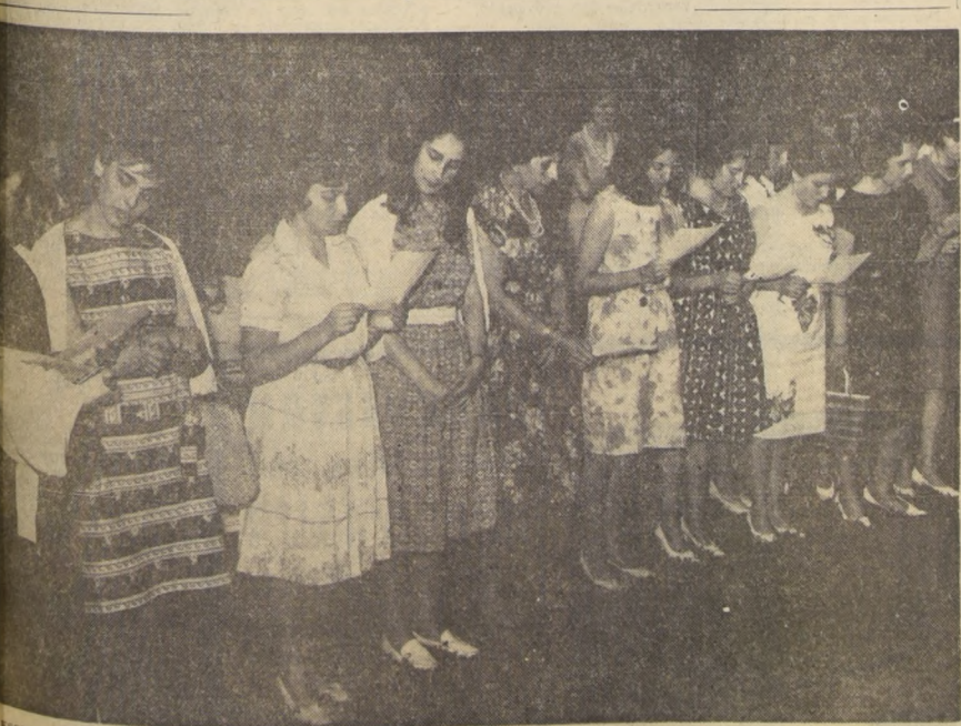
ESCUELA DE Auxiliares de Enfermería de Caritas, entre las insignias y certificados de estudios a 50 nuevas Cruzadas y 199 alumnas. La Cruzada del Servicio Voluntario de Caritas Chile, desde 1961 prepara a equipos de personas voluntarias que se dedican a labores asistenciales en poblaciones, parroquias, instituciones de beneficencia y centros sociales. En el grabado, las nuevas cruzadas durante la ceremonia de entrega de insignias.