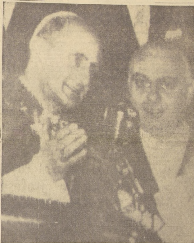
ROMA, Italia. — De regreso de su histórica gira de peregrinación a la Tierra Santa, Paulo VI se dirige a través de los micrófonos, el 6, a la multitud que le diera una calurosa bienvenida, al retornar a esta ciudad. En el grabado, Su Santidad aparece acompañado por el