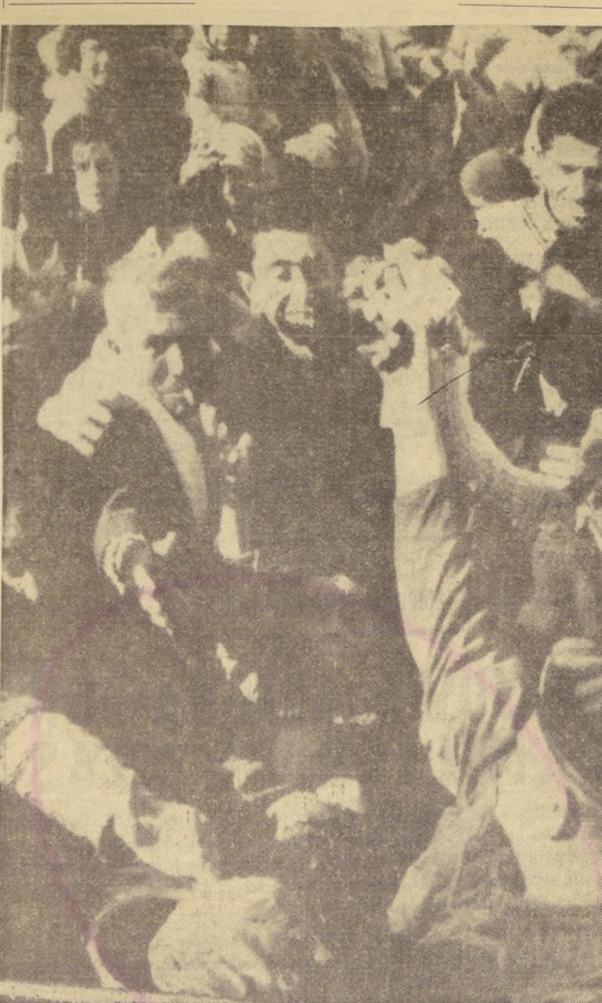
NGOSIA, Chipre. — El Presidente de Chipre, Arzobispo Makarios, aceptará el envío de un observador de las Naciones Unidas, a esa convulsada isla. La petición fue presentada por el delegado de Inglaterra ante el Presidente de la Organización, U Thant. En el grabado, tropas británicas reparten alimentos a chipriotas turcos.