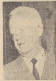
HEINRICH LÜBKE, Presidente de Alemania Occidental.

BONN, 15. — (UPI). — El Presidente de Alemania occidental, Heinrich Lübke, hará un viaje por la América Latina a fines del mes de abril y principios de mayo, se anunció esta mañana en su oficina. Lübke, dice el anuncio, visitará Argentina, Brasil, Chile y Perú. Será el primer viaje a la América Latina que realice un Jefe de Estado de Alemania occidental desde la fundación de la República Federal en 1949. Se considera el anuncio como un indicio de que Lübke también ha decidido presentarse nuevamente como candidato a la Presidencia en las próximas elecciones. Su mandato expira en septiembre. Se tiene entendido que Lübke, ha estado demorando el anuncio de su viaje a la América Latina hasta decidir si iba a presentarse como candidato para un segundo período. Sus asesores consideran que podría haber sido poco apropiado para el empuje del viaje si no tenía el propósito de presentarse como candidato a la reelección. La reelección de Lübke es segura si se presenta como candidato. El Presidente volvió recientemente de un viaje de un mes a Irán, Indonesia, Japón y Las Filipinas. El ex Canciller Konrad Adenauer también prometió a algunas personas que lo visitaron recientemente hacer un viaje por la América Latina, pero aún no ha decidido fecha para ello.