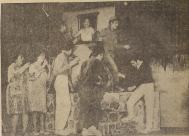
VALPARAISO.— V FESTIVAL DE TEATRO AFICIONADO EN VIÑA.— Continúa desarrollándose con gran éxito en Viña del Mar el V Festival de Teatro Aficionado Independiente, que auspician la Asociación Nacional de Egresados de la U. de Chile y la Municipalidad del balneario. Conjuntos llegados desde todos los puntos del país se presentan diariamente en la Quinta Vergara, y el público ha sabido responder a esta iniciativa de acercar las manifestaciones teatrales al pueblo. En el grabado una de las escenificaciones presentadas en el Festival por el Conjunto de Teatro de Profesores de Valparaíso, en la obra "La señora Cueto".