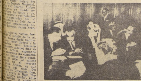
EL CAIRO. Aspecto de la mesa de la Conferencia en la Cumbre de los países árabes para tratar el caso de la desviación de las aguas del legendario río Jordán, por parte de los israelitas. La gravedad que este hecho reviste para los árabes ha logrado la fusión de los países árabes que desde hace tiempo mantienen disputas. La finalidad que piensan darle los israelitas a las aguas, es para el regadío.