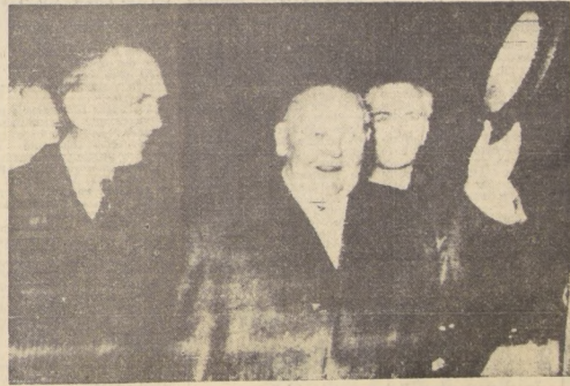
LONDRES. — El Canciller de la República Alemana, Ludwig Erhard, es recibido a su arribo a esta ciudad el 15 por el Primer Ministro inglés, Sir Alec Douglas-Home. El Canciller alemán realiza una visita a Inglaterra por dos días. Según fuentes oficiales el presidente de Alemania Occidental hará un viaje a Sudamérica, en el cual estará incluido Chile.