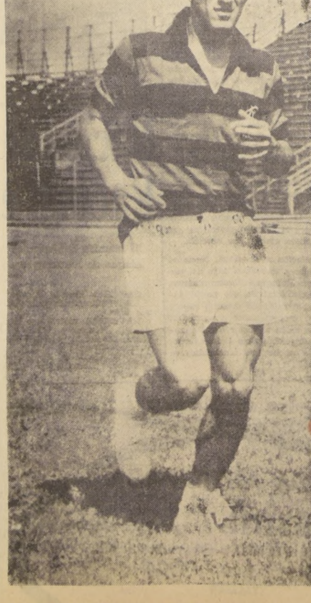
MUCHA CONCENTRACION, y disciplina, sin perder la iniciativa personal, es lo que, según Ayrton, debe hacer un player para ser un buen profesional. (JUAN CARLOS FRANCO).

MEDELLIN, 15 (UPI).— Uruguay venció a Venezuela por dos goles a uno en su partido del torneo de fútbol de la Juventud. BARRANQUILLA, (URGENTE).— 15 (UPI).— Colombia derrotó a Perú, por dos goles contra uno.