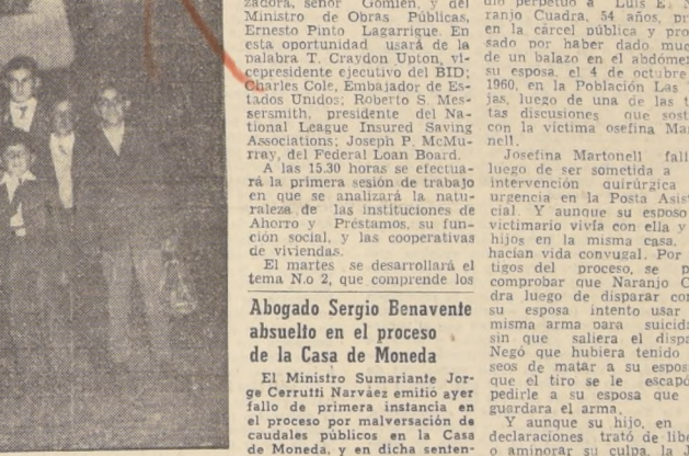
El próximo domingo se iniciará en Santiago la Segunda Reunión Interamericana de Ahorros y Préstamos, con el fin de estudiar los progresos de este sistema destinado a contribuir a la solución del problema habitacional de los pueblos de este continente.