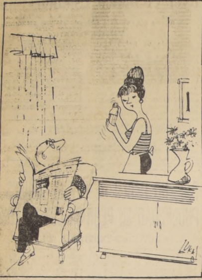
¿Qué bueno! ¿Vas a hacer un traguito? -No... Esto; lavando mi traje de baño...