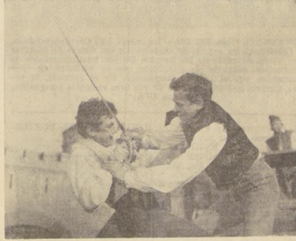
Con censura mayores y menores presenta Universal hoy en el Cine City, el cine drama de capa y espada "LA MASCARA PURPURA". Tony Curtis cumple aquí el mejor papel de su exitosa carrera de artista.