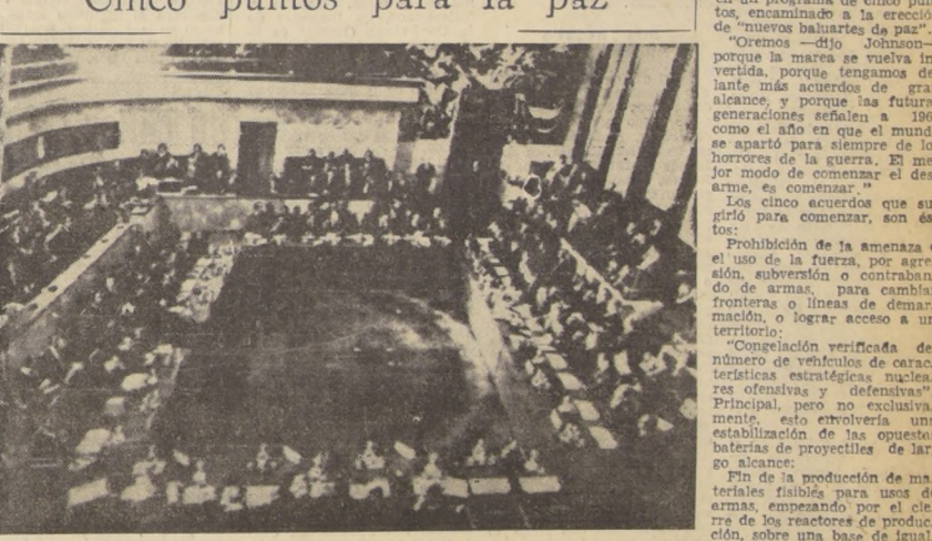
GINEBRA.— Vista general de la sala al inaugurarse la Conferencia de Desarme en esta ciudad el 21; en la conferencia intervienen 17 naciones, y ésta se mantuvo en receso por cuatro meses. En la sesión inaugural se leyó el mensaje que enviara el Presidente norteamericano Johnson, que consistió en una propuesta basada en cinco puntos para mantener la paz en el hemisferio. (Radiofoto UPI).