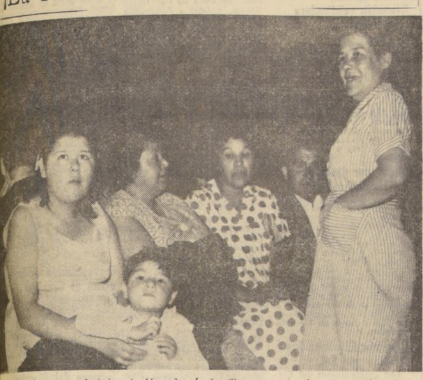
En la tarde de ayer se efectuó en la Alameda Bernardo O'Higgins la Marcha del Hambre, que llamó a la Central Única de Trabajadores. Asistieron alrededor de 1.500 personas, que se expresaron con gritos y otros slogans ya familiares en esta clase de manifestaciones. En el grabado, puede apreciarse un grupo de personas que concurren a esta "Marcha del Hambre", programada por la CUT.