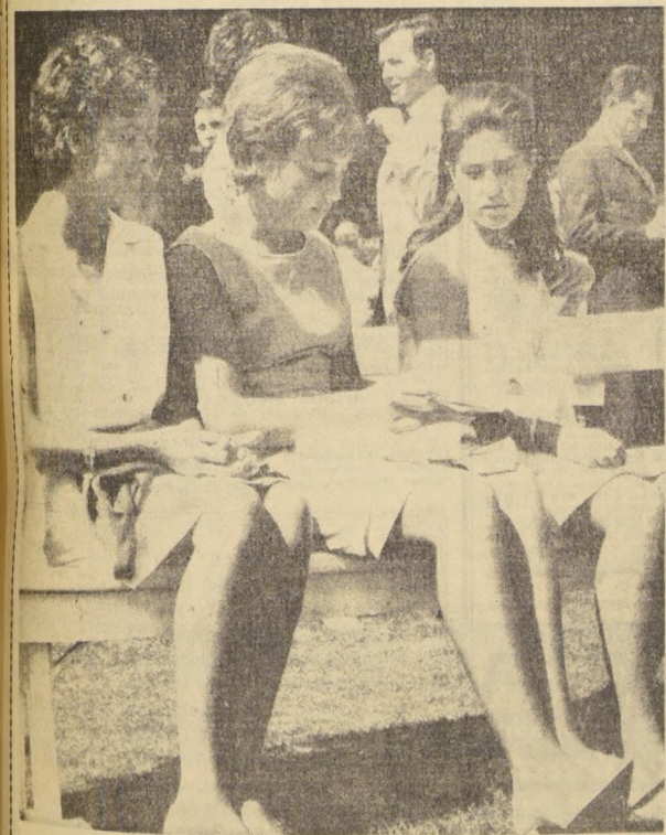
Uno de los acontecimientos de esta temporada veraniega en Vinal del Mar es, sin duda, la tradicional carrera "El Derby", que un grupo de jóvenes eligen a uno de los favoritos de esta carrera.