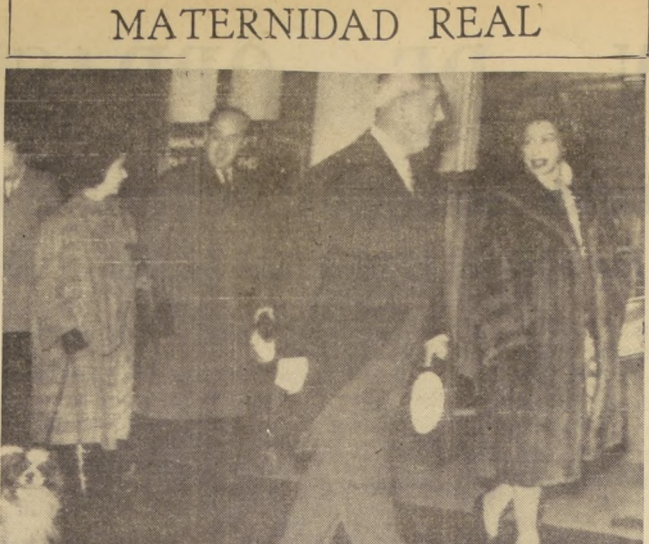
LONDRES.— La Reina Isabel II (derecha) conversa con un funcionario no identificado del Gobierno, mientras camina por el interior de la Estación de Liverpool, en dirección al Palacio de Sandringham. A la izquierda, la Princesa Margarita, quien lleva tirando de la mano derecha un cachorro real. Tanto la Reina como su hermana están esperando familia.

MOSCÚ, 21.—(UPI). — El Primer Ministro Nikita Khrushchev, anunció esta noche la firma de un convenio comercial a largo término entre Cuba y la Unión Soviética, que "dará garantías" a los cubanos contra las fluctuaciones del Mercado Mundial; Azucarero y el sabotaje de los monopolistas norteamericanos.