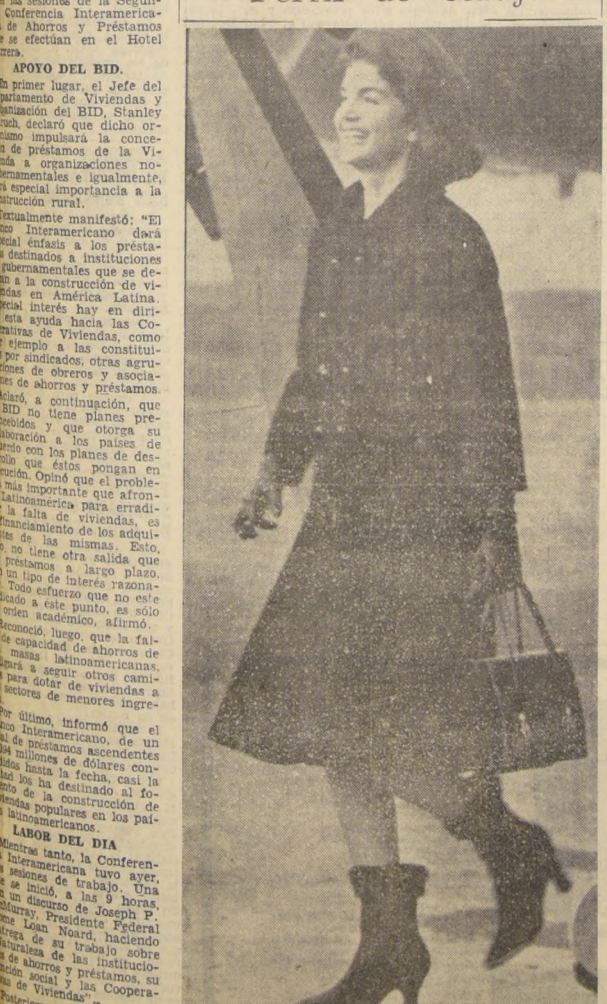
BOSTON.— Jacqueline Kennedy aparece en el grabado descendiendo del avión de su familia, llamado "Caroline", cuando llegó a esta ciudad para asistir a una misa de recordación en memoria de su esposo, John Fitzgerald Kennedy. Posteriormente, Jackie se presentó en la televisión norteamericana para agradecer a los millones de personas que le expresaron sus condolencias y la acompañaron en las duras horas vividas en noviembre del año pasado.