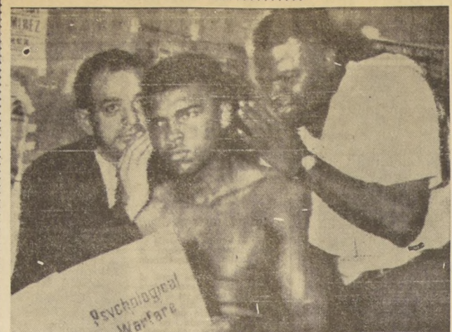
CASSIUS CLAY, retador del campeón mundial de peso pesado, Sonny Liston. Clay sostendrá la pelea en procura del título mundial, el 25 de febrero, pelea en que ambos contendores afirman vencer en forma respectivamente en la "guerra psicológica".