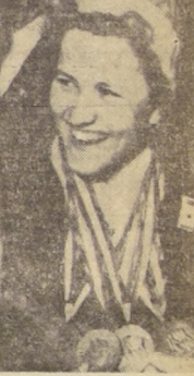
LIDIA SKOBLIKOVA, solista, posa con la cuarta medalla de oro, que ha obtenido en sendas victorias, en los Juegos Olímpicos de Invierno, que se realizan en Innsbruck, Austria. La esquiadora rusa, fue fotografiada, al término de la prueba de los 3.000 metros de patinaje sobre hielo, que ella ganó. Antes había triunfado en los 500, 1.000 y 1.500 metros, para dar, mas, de los IX Juegos de Invierno.

CARACAS, 7 (UPI). — El equipo de fútbol América, de Río de Janeiro, se impuso anoche a la Selección de la Liga Mayor por tres goles a uno en su última exhibición en Caracas. El primer tiempo terminó con una ventaja para los visitantes de dos a uno. El primer tanto lo anotó Jorge al recibir un tiro del corner de Carlingho, y aunque el portero Roche logró tocar el balón, éste se le escapó de las manos y entró en la red. A los 24 minutos Abel igualó el marcador y, sobre la hora, Zezinho puso en ventaja al América. Zezinho señaló también el tercer tanto a los 10 minutos de iniciado el segundo periodo.