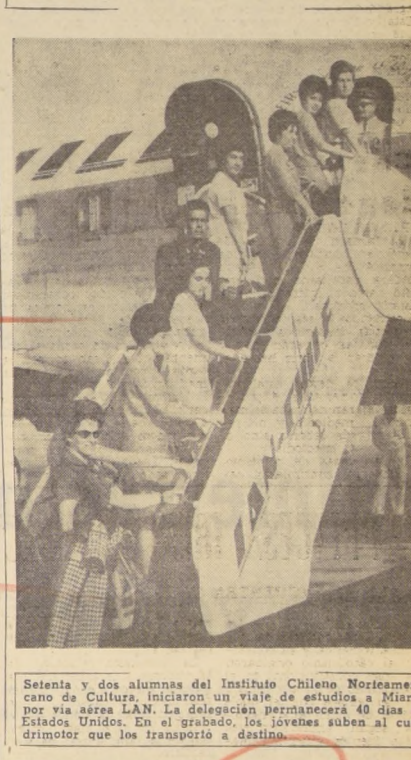
Setenta y dos alumnos del Instituto Chileno Norteamericano de Cultura iniciaron un viaje de estudios a Miami por vía aérea LAN. La delegación permanecerá 40 días en Estados Unidos. En el grabado, los jóvenes suben al cuadrómetro que los transportará a destino.