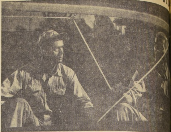
Una escena de la joya Universal en tecnicolor y para todos los sentidos "Proa al Sol", que va el miércoles al City, con Lee Remick y Jeff Chandler a la cabeza del reparto