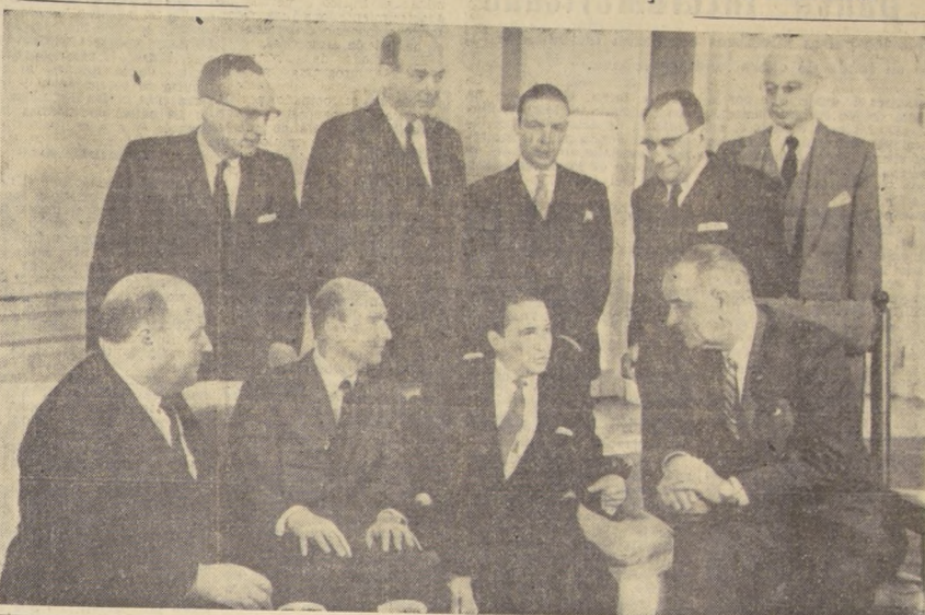
WASHINGTON.— El Presidente Johnson se reunió recientemente con la Comisión Interamericana de Paz en la Casa Blanca, para conversar sobre la cuestión surgida con Panamá...