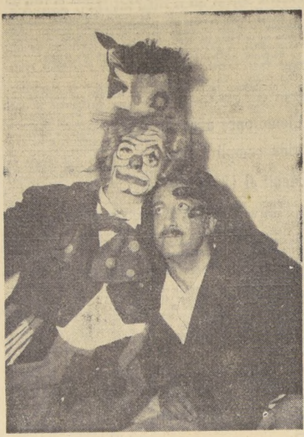
NUEVA YORK.— Cubriendo sus famosas facciones con una máscara, hace de clown con el actor Peter Sellers, antes de la filmación de una escena de "The Pink Panther". Su caracterización demuestra su talento para la comedia, que corre pareja con su dramática belleza.