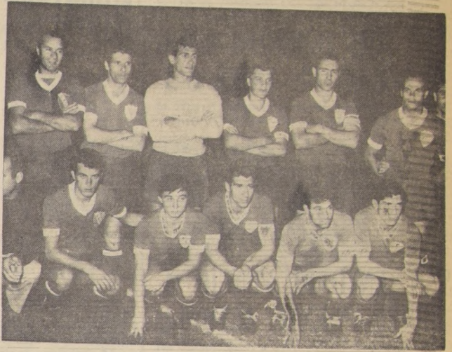
CONTRASTANDO SU BUENA disposición por las charlas entusiastas del café, los jugadores de Independiente quedaron alojados en el Hotel de Machali, lejos de las tentaciones que ofrece la capital y entregados a una tranquilidad ambiental, propicia para