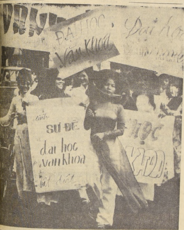
SAIGON, VIETNAM DEL SUR.— Portando banderas y estandartes un grupo de jóvenes realiza una manifestación en Saigón...