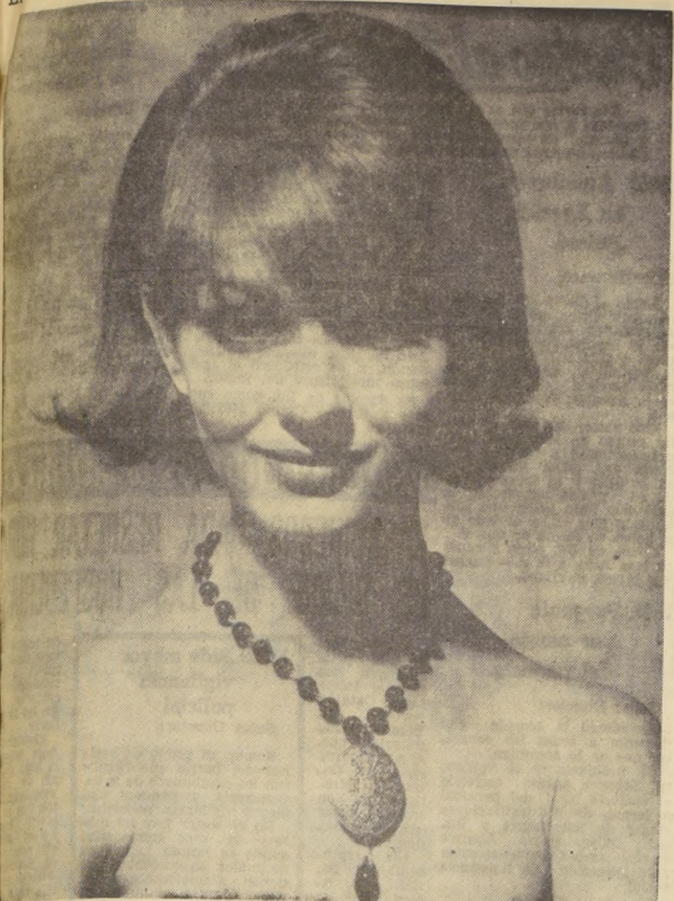
"GUEPARD" Collar de perlas negras con medallón romántico de metal oro grabado. LOLA PRUSAC.