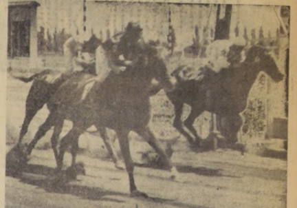
LIGHTKEEPER, conducido por Vicente Barra, vence a Océano, que corre por los palos; y Cara Dura que se agotó en los últimos metros. Con esta victoria completó doblona el preparador, Milan Rendic.

que conformar con acabar a 1/2 pesucro a la ganadora, 3/5 Riesgo a 1 cuerpo; 4/5 Arnaga a 1 1/2 cuerpos; 5/5 Big Money a pesucro — que tuvo que sobrepasar a innumeras veces a los otros favoritos. SI BELLE, vencedor de la carrera, ganó por Monette dejó en juego sólo 999 vales.