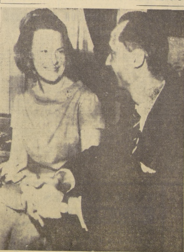
MADRID.— La pareja que agregó un nuevo quebradero de cabeza a las familias reales europeas...