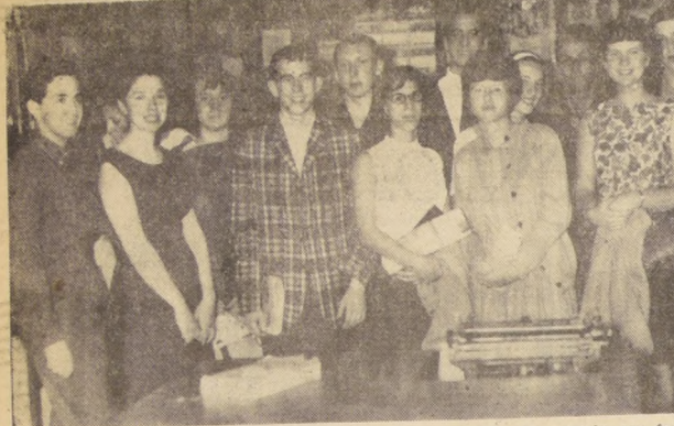
Once muchachos norteamericanos comenzaron a vivir hace dos días en Chile. Estarán un año en el país y junto con proseguir sus estudios secundarios en liceos fiscales y privados...