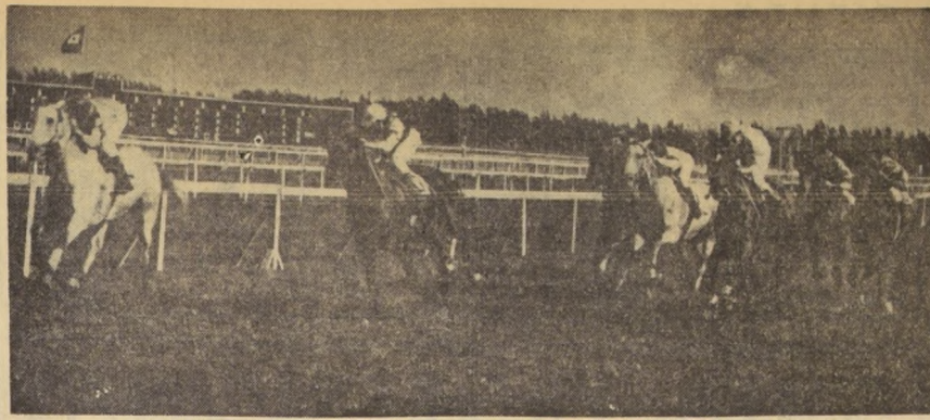
MAMBRINO se impuso, pese a los 59 kilos que cargaba, el más alto de todos los competidores, en la prueba central de la tarde. El segundo lugar fue para Ring, que atropelló con grandes energías a la legada. Le Touquet y Vejestorio le ganaron más atrás. Los 'pegados, en esta carrera, cumplieron un buen papel.