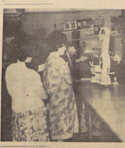
Inspectores de diferentes organismos estatales y municipales, bajo la dirección de jefes del Ministerio de Economía, realizaron visitas a diferentes establecimientos, fabricantes y expendedores de pan, en la mañana de ayer, para comprobar el respeto en los precios, calidad y peso. En el grabado puede verse a dos inspectores que han "intervenido" el mesón de una panadería y controlan el gramaje. Muchas muestras fueron llevadas posteriormente al laboratorio de la Em-

Miles de personas se concentraron esta tarde en las calles de Amsterdam para ver de cerca a Irene y al príncipe de Borbón Parma, a quienes aclamaron. El Primer Ministro, Victor G. Marijnen, anunció que el Gobierno aprobó la decisión de la rubia princesa de renunciar a su derecho al trono para poder casarse con Carlos, que aunque perteneciente a la nobleza española es paracaidista en el Ejército de Francia.