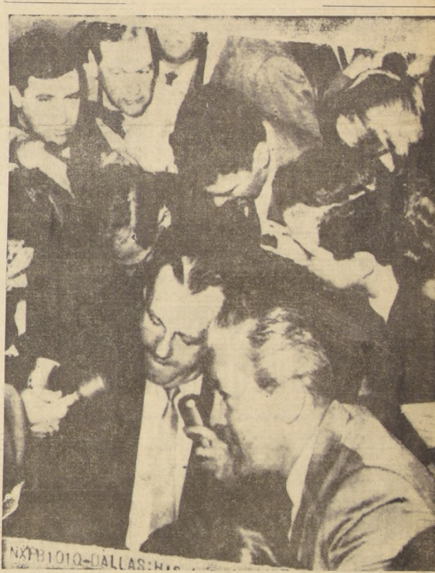
DALLAS, Tejas.— Nervioso se le vio a Jack Ruby, al ser prácticamente acorralado por los periodistas a su llegada a la Corte, ayer 10. En este tribunal se decidirá en qué lugar se llevará a cabo el proceso en contra de Ruby por haber dado muerte al presunto asesino del Presidente Kennedy. De no transferirse el proceso a otra ciudad, el juicio se iniciará a mediados de febrero en la ciudad de Dallas según declaración del Magistrado que sustancia el proceso.