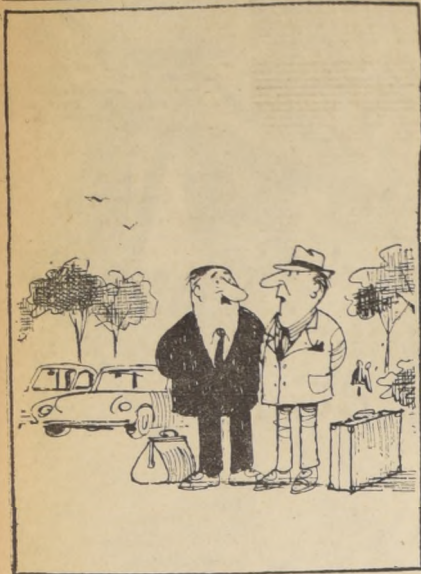
—Estamos haciendo el ridículo ofreciendo pañuelos de seda y calugas suizas, en estos tiempos...