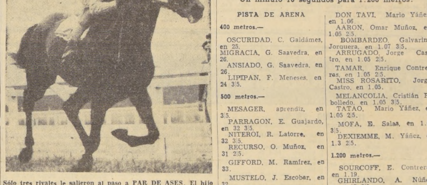
Sólo tres rivales le salieron al paso a PAR DE ASES. El hijo de Paresa, que ahora defiende las sedas del "Choapa" corrará el próximo domingo los 2.000 metros del premio "Saint Leger".