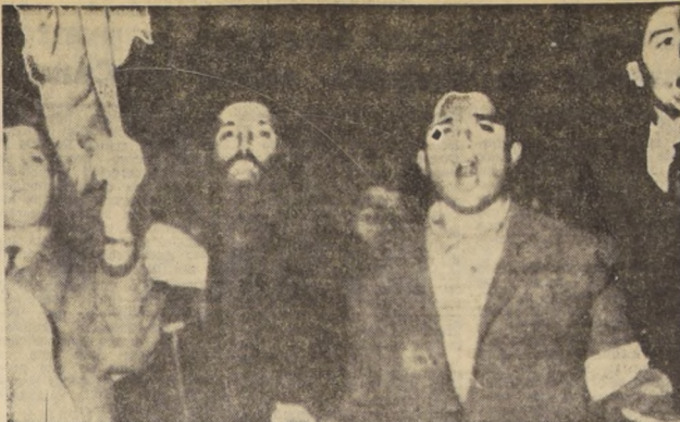
ATENAS, Grecia. — Manifestantes vociferaron por las disputas entre los chipriotas griegos y turcos. Los manifestantes marcharon frente a las Embajadas de Estados Unidos y Gran Bretaña en su demostración de la organización para pacificar la isla de Chipre, que se encuentra convulsionada por las disputas entre los chipriotas griegos y turcos.

SN. ANTONIO 449 SN. DIEGO 2301 ECHEVERRIA 935 PORTUGAL 931 TEL. 35123