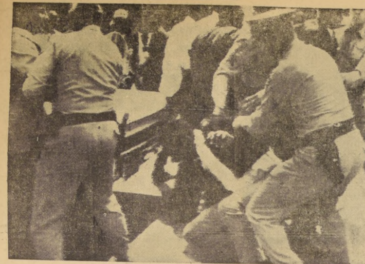
PHOENIX, Arizona. — La policía irrumpe sobre una manifestación de protesta contra la segregación racial, efectuada aquí. Centenares de jóvenes de color bloquearon las

calles de esta ciudad durante el mediodía, justamente durante las horas de mayor congestión en el tránsito.