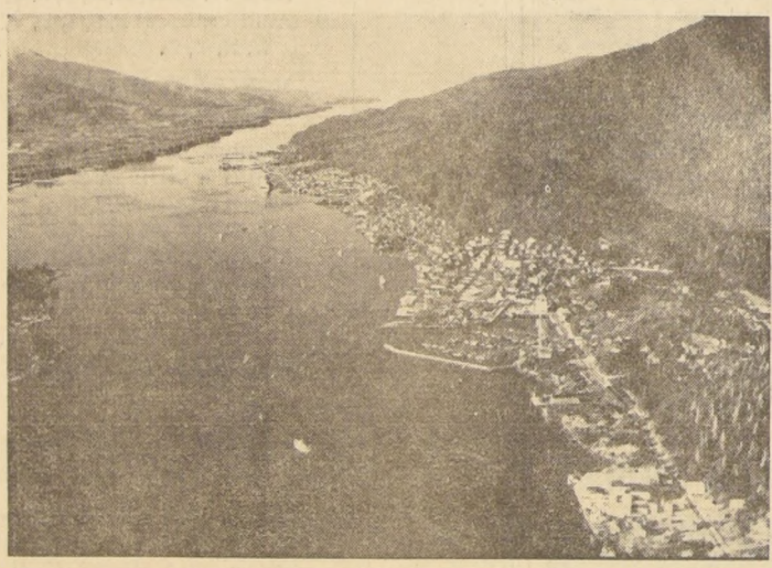
ALASKA — Ketchikan, el principal puerto de la costa sur-oriental de Alaska, es el primer punto de reabida de los buques que se dirigen hacia el norte. Cuenta con un bien protegido puerto frente a la tierra firme, que dista 757 millas por vía marítima, y 659 millas por aire de Seattle, en el Estado de Washington, el puerto norteamericano más

proximo. Conocida, principalmente, por sus pesquerías y sus industrias anexas, Ketchikan cuenta con una población de 7.500 habitantes. En ella hay también una gran industria elaboradora de madera y de pulpa de madera, que es la más importante de Alaska.