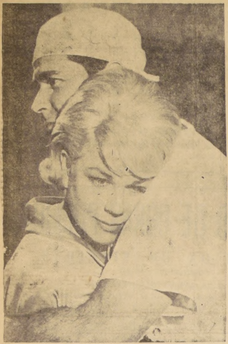
Doris Day y James Garner marchan a la cabeza del espectáculo frívolo en la deliciosa comedia "LA SALSA DE LA VIDA", que hoy entra en el Astor a una nueva y segunda semana. Esta película batió todos los records de taquilla del teatro Radio City Music Hall de Nueva York, el más grande del mundo.

Entra "LA SALSA DE LA VIDA" a su segunda semana en el Cine Astor. Fascinantes colores y desbordante alegría, y todo en tecnicolor!