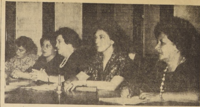
MUJERES RADICALES INSISTEN EN RETIRO DE RENUNCIA DE DURAN.— El ampliado celebrado ayer por la Organización Femenina Radical así lo acordó por unanimidad. En el grabado, un aspecto de la Mesa que presidió la reunión. Izquierda a derecha, De-