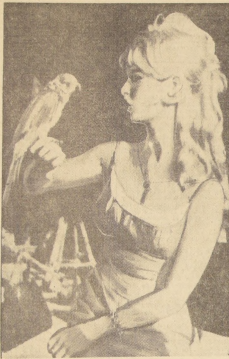
RIO DE JANEIRO. — Después de dos meses de silencio, Brigitte Bardot emergió de su retiro. La foto la muestra en su nueva residencia —la quinta de su propiedad—, enclavada en un lugar cercano a Rio, llamado Valle Encantado. En su mano izquierda, Brigitte sostiene a un loro, con el cual pareciera hablar