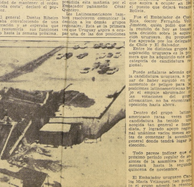
ANCHORAGE, Alaska. — Unavista aérea parcial, muestra aquí numerosas casas destruidas por el tremendo terremoto del 28. Un soldado norteamericano, en primer plano, camina entre los escombros. Nótese cómo la violencia del temblor quebró la casa, que se ve a primera vista como si fuera una galleta.