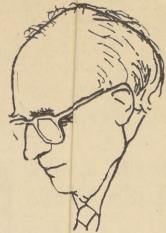
Salvador de Madariaga.

Su conclusión fue que los españoles son europeos, ni mejores ni peores que los demás europeos, pero que tienen, aún, mucho por hacer. Tendrá que alcanzarse una síntesis entre los que afirman que "el África empieza en los Pirineos" y los que dicen que "ya no hay Pirineos". Terminó Madariaga diciendo: "Somos europeos pero complicados. Los españoles somos tan malos, que es maravilloso lo bien que nos conducimos".