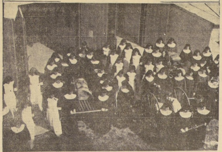
Al son de la alarma las monjas se precipitaron en su hábito negro hacia su equipo de bomberos. Ahora esperan las órdenes para manejar mangueras, escalas y camillas.