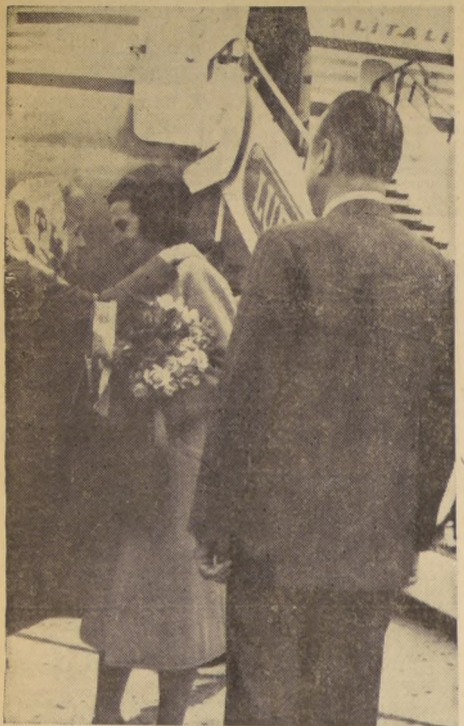
Fue despedida en Los Cerrillos por altas personalidades la princesa Liliana de Rethy, quien, luego de breve estadía en Chile, regresó por ALITALIA en vuelo a Roma.