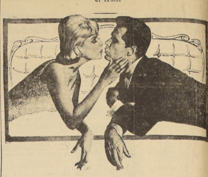
La pareja Doris Day-James Garner se está haciendo aplaudir en el cine Astor. Numerosas personas están disfrutando con 'LA SALSA DE LA VIDA', que lleva ya dos semanas de triunfantes presentaciones. El ambiente mismo del film, los lujosos escenarios, su feticolor perfecto, la hábil dirección, todo es un marco adecuado al trabajo de Doris Day, que muestra a través de ella la cínica su versatilidad como actriz comparable. Es una joya de Universal.

reúne los ingredientes de la comedia brillante y Doris Day le concede el cautivador encanto de su personalidad. Dos semanas en el Astor