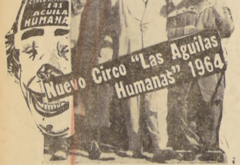
"Nuevo Circo 'Las Aguilas Humanas' 1964"

Obtuvo un éxito sensacional con su primera película, "Big Deal on Madonna Street", y fue inmediatamente tratada como una estrella. Se le confiaron papeles importantes en varios éxitos italianos, tales como "Bell'Antonio", "Rocco and His Brothers", "The Girl with the Suitcase" y "La Viaccia".