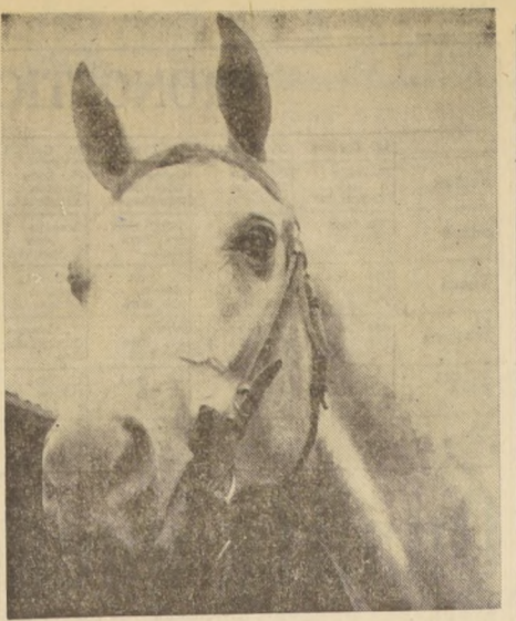
SCHULERIN, se presentará en una prueba condicional el domingo, en el Club Hípico. La pupila Real Allien defectuosa en el Cotejo, pero después ha seguido progresando.