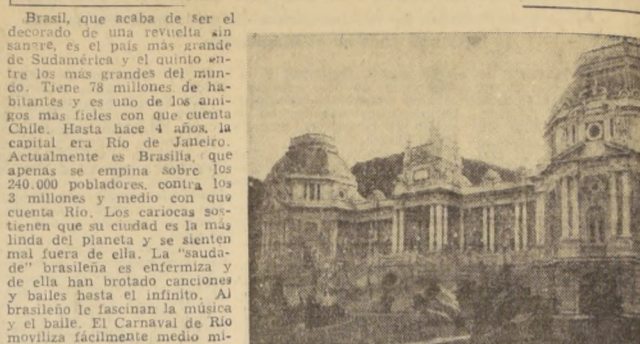
PALACIO DE GUANABARA