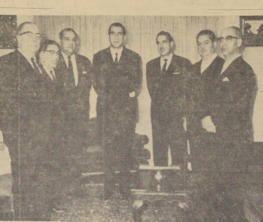
A las numerosas visitas recibidas ayer por el Presidente electo de Chile, Eduardo Frei, se sumó una delegación de Jefes de Misiones Diplomáticas de Gobiernos Centroamericanos que llegó hasta la residencia del señor Frei, para exteriorizarle las congratulaciones de sus respectivos Jefes de Estado. En cordial charla se cambiaron impresiones sobre diversas materias relacionadas con los vínculos que unen a Chile con esos países. EN EL GRABADO, un aspecto de esta reunión.