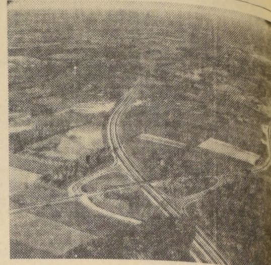
ruta 401, entre Woodstock y Galt, en Ontario, Canadá.

Con todo, entre la actividad y la esperanza, se va formando una población entre mezclada, de fuerte espíritu democrático, aún cuando se deja notar menos presión social, para renunciar a la convivencia con los "paisanos" de afuera. La edificación es, naturalmente, espaciosa, y a unas cuantas cuadras de los altos edificios del centro comercial, se extienden los barrios residenciales con sus bungalows de un solo piso, que prolongan la anchura de las calles al dejar al frente de cada uno su lonja de verdor, matizada por raras flores de tonos muy vivos. Estas avenidas exteriores están plantadas de arces (maple trees), el árbol cuya hoja ha de servir como enseña nacional adscripta a la bandera canadiense.