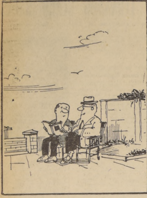
—Como Ud. ve, mis cálculos previos fueron claramente confirmados por las urnas.