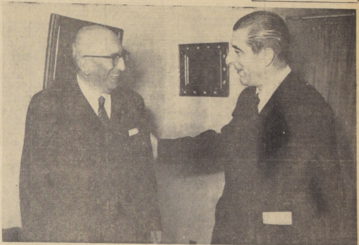
El Presidente de la Corte de Apelaciones de Santiago, se...