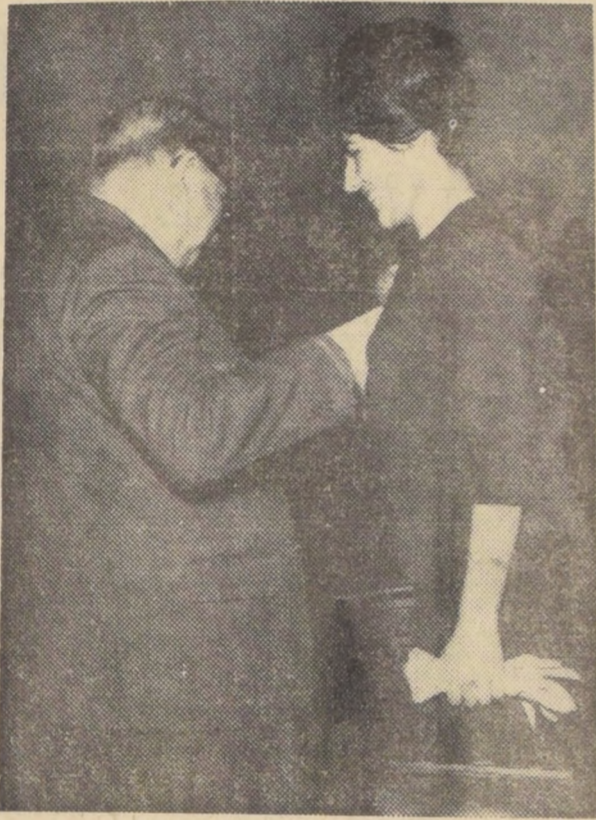
Durante el acto celebrado ayer en el Salón de Honor de la U...