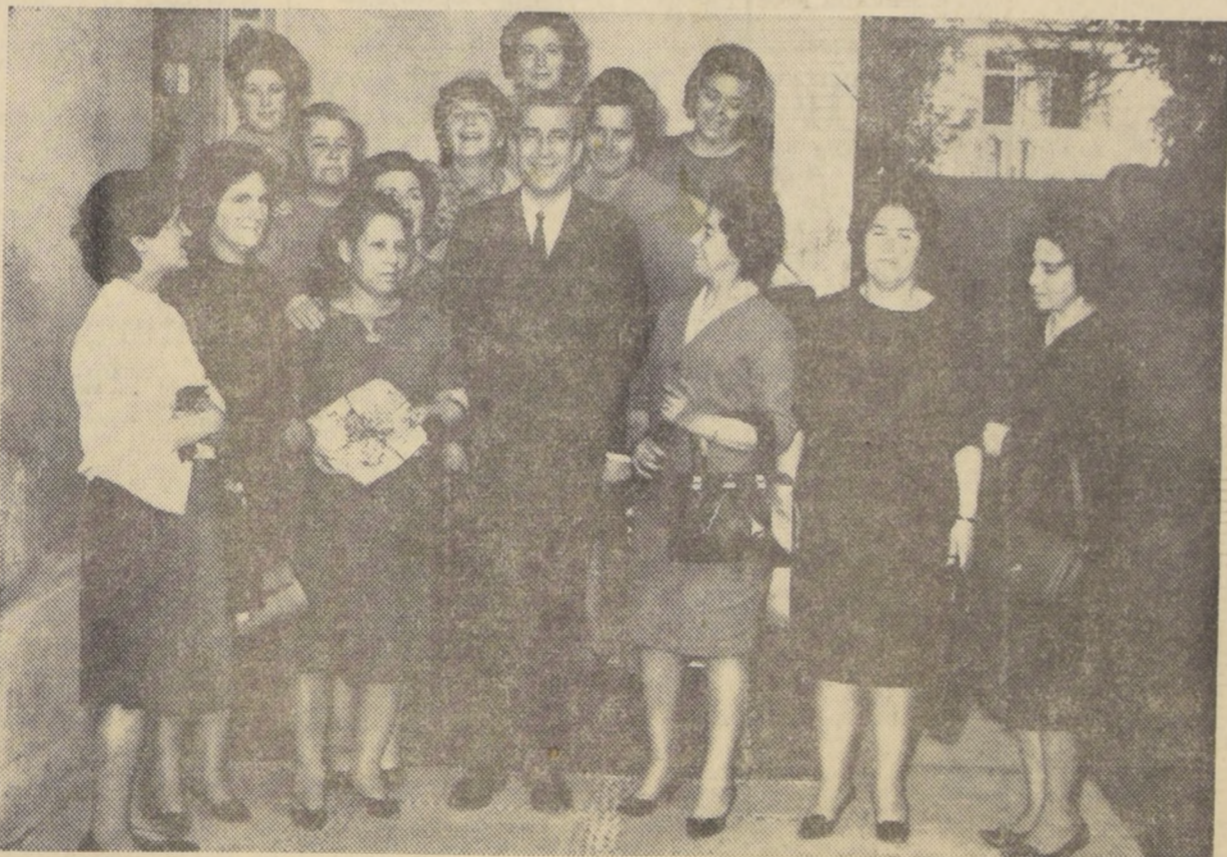
Una delegación representativa de las mujeres de la Población Dávila...