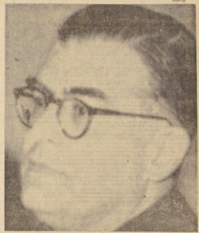
Ya está decidido que el senador Radomiro Tomic acepte la Embajada de Chile en Washington. Viajará a E.E. UU. en febrero próximo.

35% sobre el precio que señala la factura de compra a los mayoristas, y los comerciantes ocasionales, que se instalan en calles poco antes de estas festividades, sólo un 20%, ya que no pagan local, patente, impuestos, etcétera. Con estas medidas arbitradas por el Ministerio de Economía, los niños que contemplan, como el del grabado, las vitrinas, no estarán privados de juguetes y sus padres no incurrirán en gastos prohibitivos.