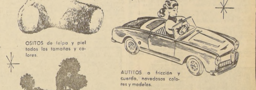
AUTITOS a fricción y cuerda, novedades colores y modelos.