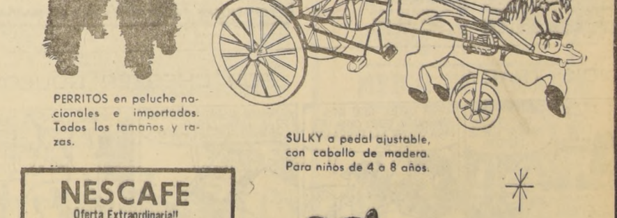
PERRITOS en peluche nacionales e importados. Todos los tamaños y razas. SULKY a pedal ajustable, con caballo de madera. Para niños de 4 a 8 años.