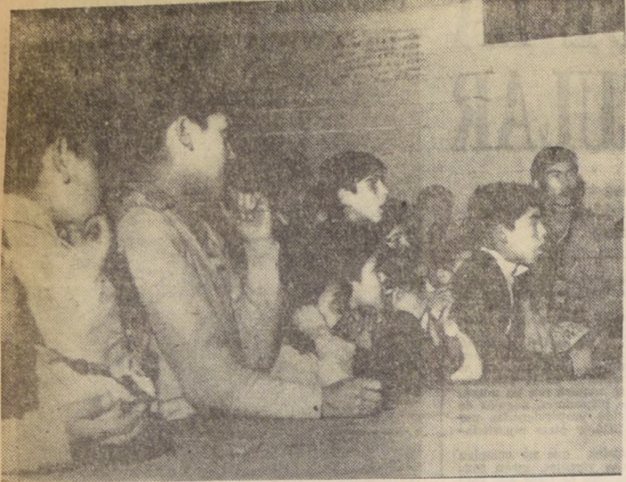
A TRAVÉS DE SUS OJOS asombrados primero, curiosos después y siempre llenos de interés, penetran las imágenes, de la TV, reflejos del mundo entero, formando en sus espíritus las nociones de todo lo que no conocían: todo lo visible ya no es un misterio para ellos.