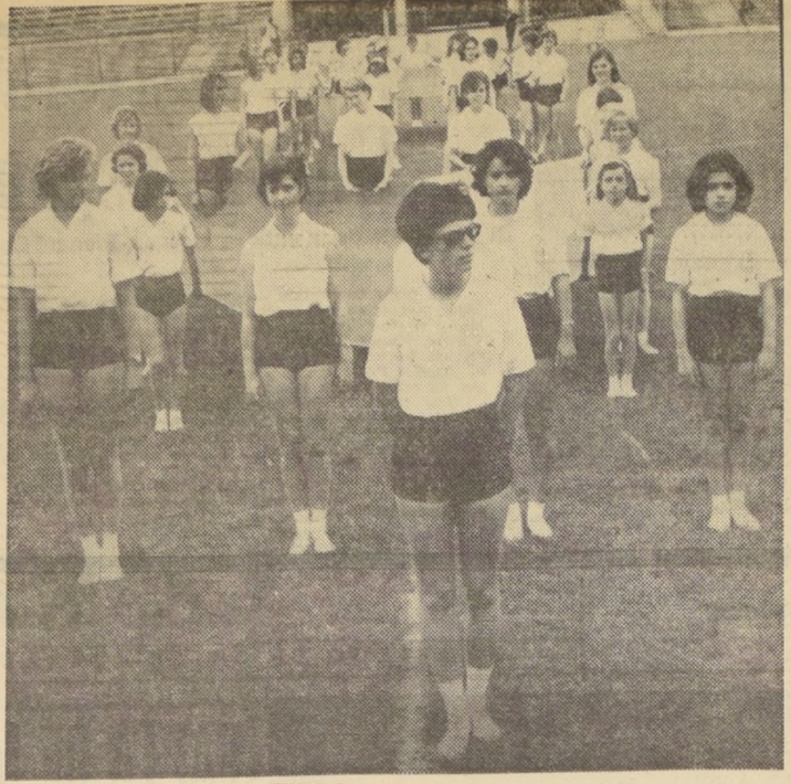
COMO EN OTRAS OPORTUNIDADES, el Colegio Alemán de Santiago, estará numerosamente representado en el Campeonato Femenino de Atletismo para los Colegios Particulares. EN EL GRABADO, uno de los equipos que actuaron en otros certámenes.

Lo anterior es en lo que respecta al Torneo de División de Honor. Los partidos correspondientes a la División de Ascenso son: San Gabriel con Liceo Alemán; Patrocinio de San José con Seminario; Liceo Leonador Murialdo con Colegio Claretiano; Escuela Baía con Liceo Manuel Arriarán. Hacen de locales los colegios nombrados en primer término, salvo el caso de Patrocinio con Seminario que juegan en la cancha de Saint George's.