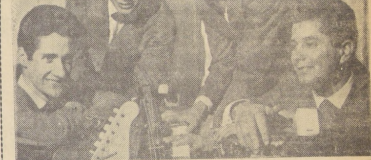
LOS RED JUNIORS volverían a cumplir presentaciones radiales. Compraron nuevos equipos, preparando en esta forma su salida al extranjero. Este año deben grabar tres LP; ya partieron con el primero.