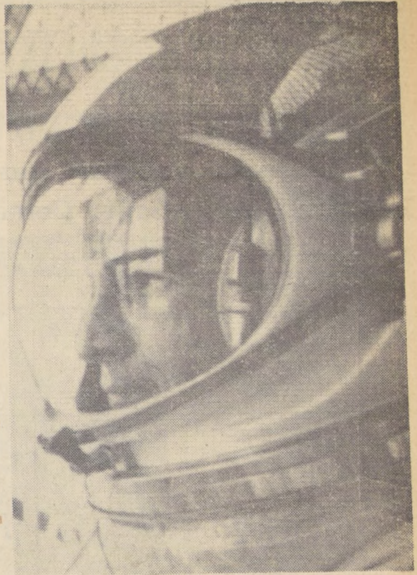
WHITE, ha dormido feliz