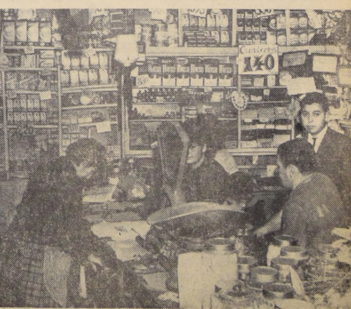
Este almacén que hoy vende el Rinsu a E° 0,88 y el aceite a E° 2,08, cambiará sus letreros en la próxima semana por cifras menores, que asombrarán a las dueñas de casa. La razón es que su dueño se unió a la Campaña de Precios Bajos que auspicia el Consejo Nacional contra la Inflación. "Si salimos adelante, el beneficio será para todos", expresó el comerciante.

En la población "J. M. Caro", está funcionando un Consultorio Externo Nocturno, que inicia sus actividades, a las 18 horas, y las finaliza, a las 8 horas del día siguiente.