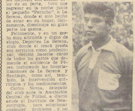
ALBUMINAS se necesitaban para su tratamiento y en las farmacias no había. Felizmente se encontró en el laboratorio que lo fabrica, 800 escudos costó el remedio.