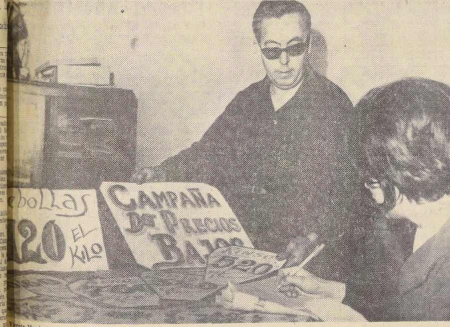
Este almacén que hoy vende el Rinsu a E° 0,88 y el aceite a E° 2,08, cambiará sus letreros en la próxima semana por cifras menores, que asombrarán a las dueñas de casa. La razón es que su dueño se unió a la Campaña de Precios Bajos que auspicia el Consejo Nacional contra la Inflación. "Si salimos adelante, el beneficio será para todos", expresó el comerciante.

Un número cada día mayor de entidades representativas de sectores de la producción está expresando al Comando Nacional contra la Inflación, CONCIN, su adhesión a la campaña que por encargo del Supremo Gobierno ha emprendido ese organismo.