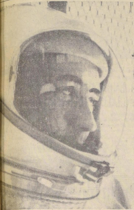
McDIVITT, sorprendido con un objeto extraño

TIEMPO PARA SANTIAGO: Nuboso e inestable con algunas precipitaciones al atardecer. TEMPERATURA DE AYER: Mínima, 8,9° C, a las 5.10 horas. Máxima, 26,3° C, a las 14 horas. PROMOSTICO: Zonas sur y central nuboso e inestable. TIEMPO EN ARICA: Mínima, 16° C, a las 4 horas. Máxima, 22° C, a las 16 horas.