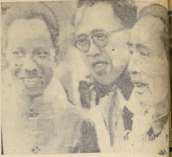
DAR ES SALAAM, Tanzania. — El Primer Ministro chino comunista, Chou En-lai, es recibido por el Presidente de Tanzania, Julius Nyerere (derecha), en su arribo al aeropuerto de esta ciudad en su gira que realiza por los países africanos.

Las reservas estadounidenses de oro bajaron, según los datos ya difundidos por el Departamento del Tesoro, a un nivel más bajo que el 23 de noviembre de 1964. La declinación de las reservas estadounidenses, persiste desde 1958, el período 1958-64, totalizando un millón de dólares; 2.247 millones en 1959, 1.689 en 1960, 678 en 1962, 465 en 1963 y 125 millones en 1964.