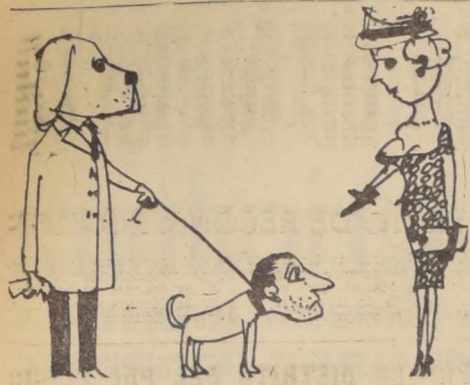
—Qué hermoso ejemplar de hombre. ¿De qué raza es?

Los resultados de esta experiencia han sido sorprendentes. Jóvenes que tal vez jamás hubieran pensado en dedicarse a la enseñanza, reaccionaron con entusiasmo y decisión. En lugar de los 1.600 con los que se contaba, se presentaron 2.890 personas aptas para dedicarse al magisterio en las escuelas; a lo que se añade que entre los estudiantes que recientemente habían concluido sus estudios medios, se descubrieron verdaderos talentos. Ka.