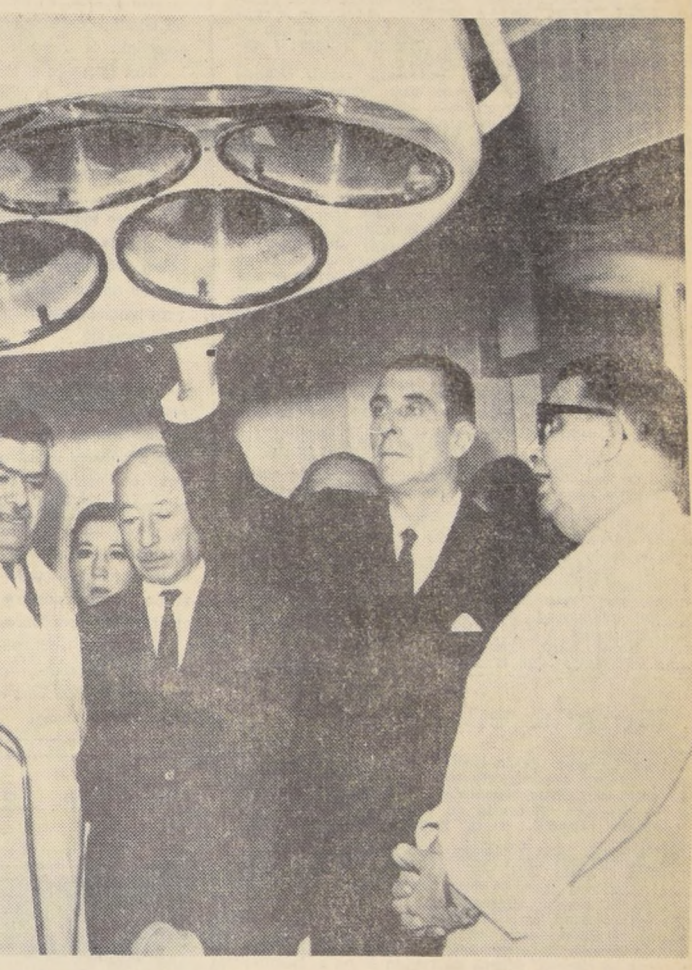
EL PRESIDENTE FREI, inspecciona las instalaciones de un moderno Pabellón de Cirugía, durante la inauguración del nuevo Servicio Asistencial, del Hospital "Barros Luco-Trudeau". Este Servicio cuenta con siete completos Pabellones y una capacidad total de 150 camas de hospitalización.

El Presidente Frei inauguró ayer, el nuevo Servicio de Cirugía del Hospital "Barros Luco-Trudeau", integrado por siete pabellones de operaciones, con un total de 150 camas, laboratorio y central de esterilización.