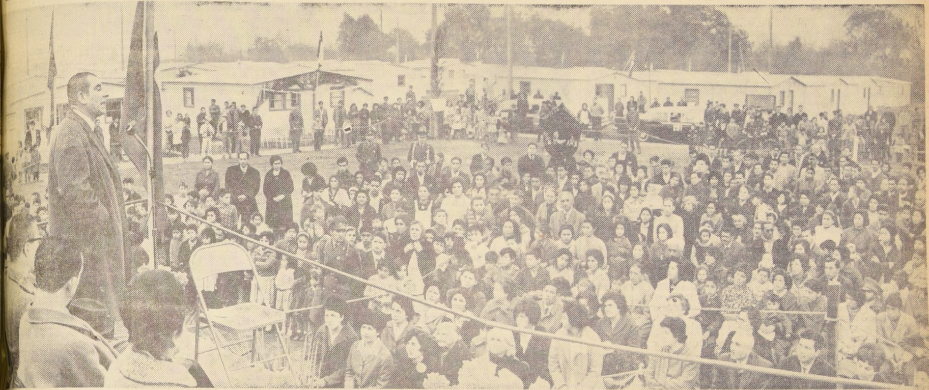
Mandatario inauguró ayer, a las 10 horas, la población “Irene Frei”, en la comuna de Conchalí. Allí fueron 88 familias desde la población callampa “Las Mercedes”, quienes dieron una extraordinaria bienvenida al Presidente, le regalaron ramos de flores, le dieron las gracias y lo invitaron a visitar sus hogares. Todo el sector estaba aban-

Yo sé que hay gente que cuando uno levanta una casa, está triste porque el Gobierno está actuando. No importa. El pueblo que es sabio porque es pobre y porque ha sufrido, sabe quiénes quieren su progreso. No me den las gracias por estas casas porque las hicieron ustedes. Allá en el norte se levantaron otras con la ayuda de marinos, militares, carabineros y universitarios, pero por sobre todo gracias a los brazos de nuestras mujeres y de nuestros hombres. Les aseguro que al término de mi Gobierno, habrán desaparecido las poblaciones callampas del territorio chileno.