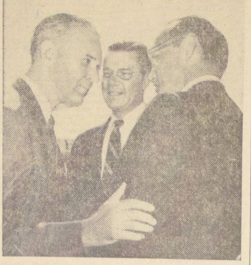
WASHINGTON.— El ex Embajador de Estados Unidos en Saigón, Maxwel Taylor (izquierda), es recibido en el aeropuerto...

"Los cañones deberán enmudecer, la agresión de los Estados Unidos en Vietnam deberá terminar..."