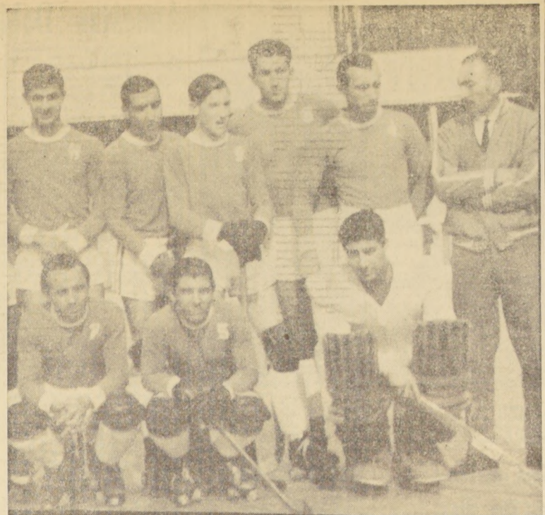
EXCELENTE PREPARACION demostraron los integrantes de Unión Estudiantil, de Argentina, condición que les valió el título de campeones...