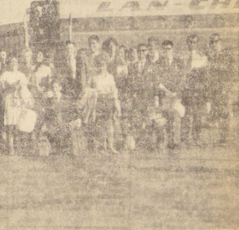
PERMANECERAN DOS MESES EN ESTADOS UNIDOS. Bajo los auspicios del Experimento de Convivencia Internacional en Chile...