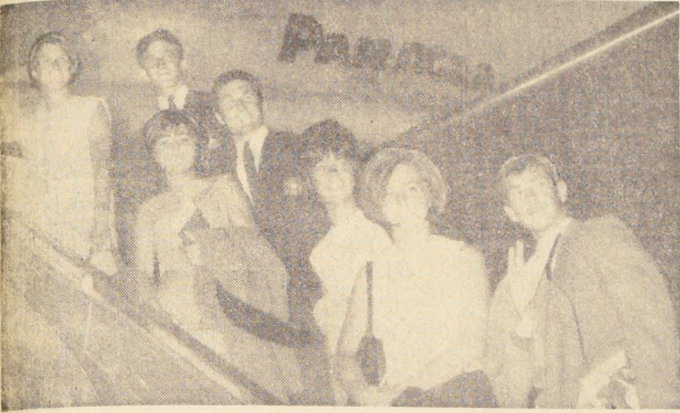
UNA BUENA MEDIDA.— El Comité Ejecutivo del Torneo Mundial de Esquí, preocupado por la actuación del equipo chileno, acordó enviar a sus representantes a Estados Unidos para someterlos a un intenso entrenamiento en Vail, Colorado...