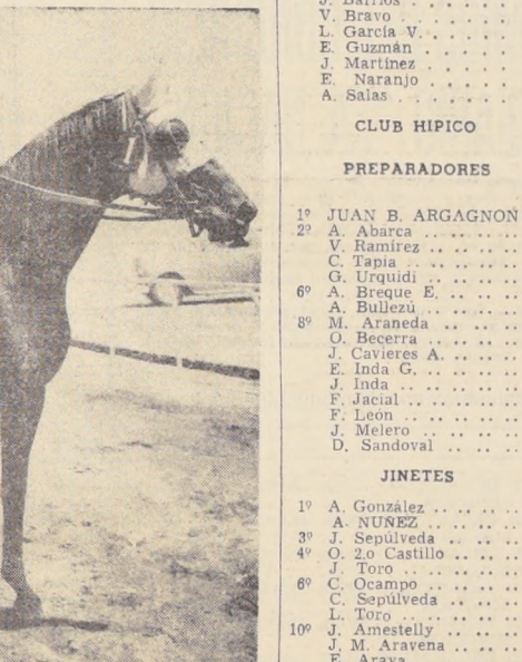
PEDRO ULLOA continúa en Vía del Mar y es uno de los jockeys más cotizados, sobre todo en pruebas clásicas.