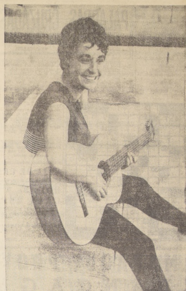
CECILIA, la popular cantante que ganó el Premio del Festival de la Canción de Viña del Mar, en 1965. Viajó en su avión al Festival Español de la Canción, en Benidorm (España), donde obtuvo un éxito clamoroso. Ahora vendrán a Viña los Ganadores de Benidorm. Así comenzó la colaboración cultural que en julio significará el comienzo de los Festivales Iberoamericanos de la Canción, cuya primera fecha será en Benidorm y la siguiente en Viña del Mar.

MAIPO, Monjitas 879 (3912011). — Rot. de 10 horas: ¿Dónde están los espías? EE. UU. Comedia. Mayores de 21 años.