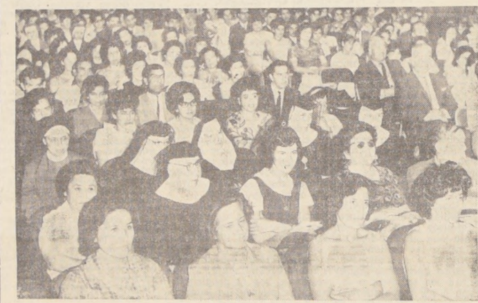
Con asistencia de aproximadamente 200 profesores-alumnos, fue inaugurado ayer y simultáneamente en el resto del país, el Curso de Preparación para el séptimo año de la enseñanza básica que comenzará a regir en 1966. EN EL GRABADO, un grupo de los maestros asistentes al acto desarrollado en la Casa Central de la Universidad Católica.

En marzo próximo, la ACHISINA y los organismos especializados de la U. de Chile, celebrarán la primera reunión del comité organizador, con el fin de designar las comisiones que tendrán a su cargo la realización del Cuarto Congreso Mundial de Sismología.