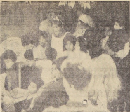
En medio de la amistad y entusiasmo de los habitantes de la provincia de Arauco, 300 universitarios de la Católica trabajan construyendo caminos y policlínicas, atendiendo enfermos, edificando escuelas, y llevando alegría con los conjuntos folklóricos. EN EL GRABADO, estudiantes de las Escuelas de Medicina y Enfermería realizan una campaña masiva de vacunación en toda la provincia.