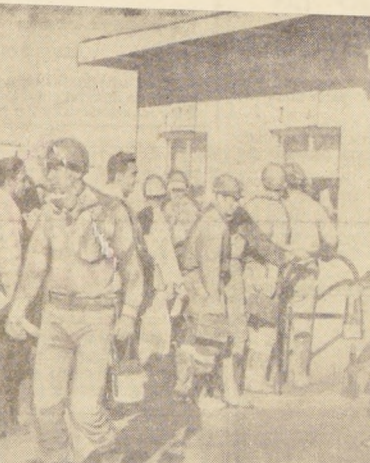
EN FORMA PAULATINA, han continuado reintegrándose a sus labores los mineros de Potrerillos, El Salvador y Barquitos, que habían sido arrastrados a la huelga ilegal ordenada por la CTC a sus bases, como «solidarios» con los obreros y empleados de El Teniente. Ratificando el repudio de los trabajadores del Cobre hacia las maniobras de los partidos de Oposición, Chuquicamata no adhirió al paro, pese a los insistentes llamados de algunos parlamentarios de extrema izquierda que viajaron especialmente a la zona con ese fin.