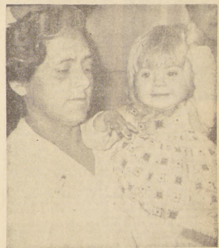
Una pequeña rubicita de año y medio de edad, vive en inocencia un drama inexplicable. Por causas aún no determinadas con claridad quedó separada de su madre en el Puerto de San Antonio y traída a la capital por su seudo raptor. Hoy se encuentra en una casa amiga, donde se la quiere como hija, mientras la policía se esfuerza por ubicar a su madre.