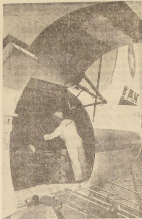
MAS AYUDA A DAMNIFICADOS ARGENTINOS.— Once toneladas de ayuda para los damnificados por los temporales en las provincias del norte de Argentina, envió ayer el Gobierno de Chile. EN EL GRABADO, estaban la ayuda en el carguero DC-6A de LAN-Chile, que despegó a las 15.30 horas de ayer desde Los Cerrillos. Este es el segundo envío con idéntico destino.

En nuestro país celebrarán diversas entrevistas con representantes del Comité Nacional de la Lana, que forman representantes de la CORFO, de Cooperativas y Sociedades Ganaderas y productores textiles.