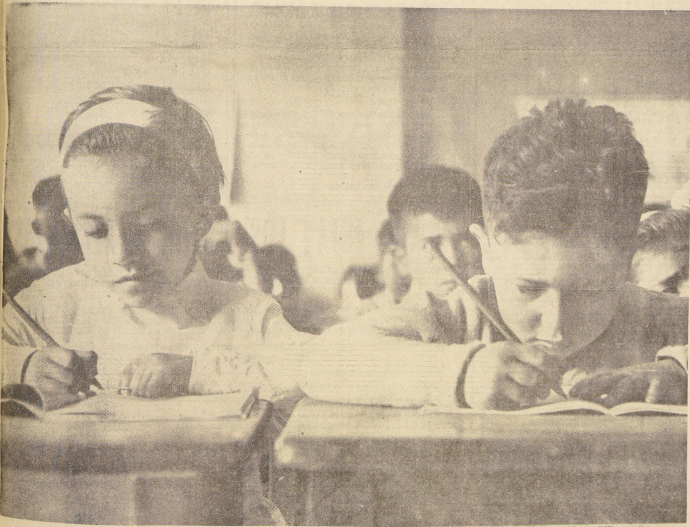
En todas las escuelas primarias se iniciaron ayer las clases correspondientes al año escolar 1966. A lo largo de todo el país se repitieron escenas como la que ilustra el grabado, en que los noveles alumnos se esfuerzan por concentrarse en sus estudios, ya un poco olvidados durante el reparador período de vacaciones.