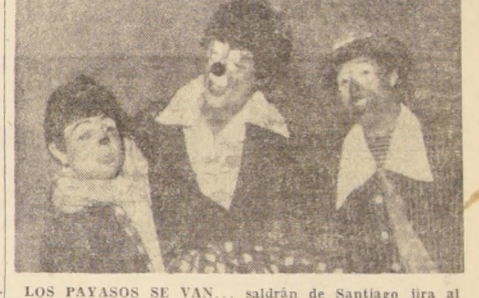
LOS PAYASOS SE VAN... saldrán de Santiago jira al norte, a Bolivia, Argentina, Uruguay y Brasil.