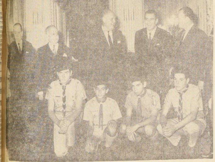
Los miembros de la Comisión Interamericana de Scoutismo que interirán el jueves en el Congreso en la capital, concurren ayer hasta el despacho del Presidente Frei con el objeto de efectuar una visita de cortesía.

Dentro de los planes de Adiestramiento y Perfeccionamiento del Personal del Servicio Nacional de Salud, el próximo miércoles serán inaugurados en el Auditorio del Colegio San Ignacio los cursos de recuperación de enseñanza media y comunitaria para el personal, programa que se realiza por primera vez en este organismo en Santiago.