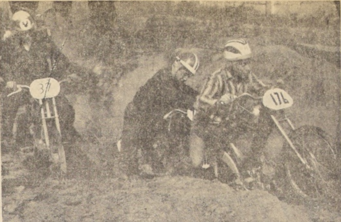
CON UNA REUNION en el Autodromo de Las Vizcachas, que consulta en su programa cinco pruebas...

Lo organiza la rama de motociclismo de Green-Cross e intervendran todos los ases chilenos de esta especialidad deportiva