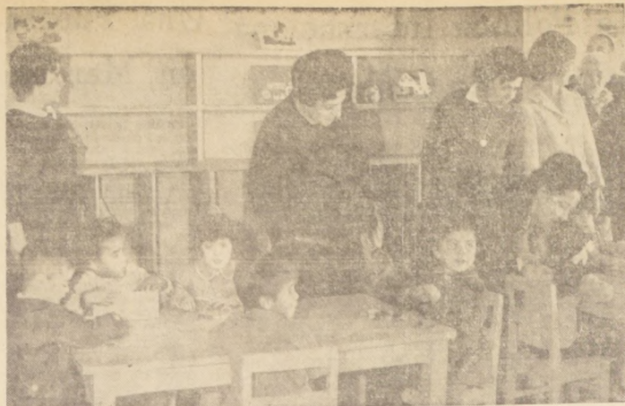
Los pequeños de la Población "Villa Esmeralda" cuentan ahora con un Jardín Infantil...