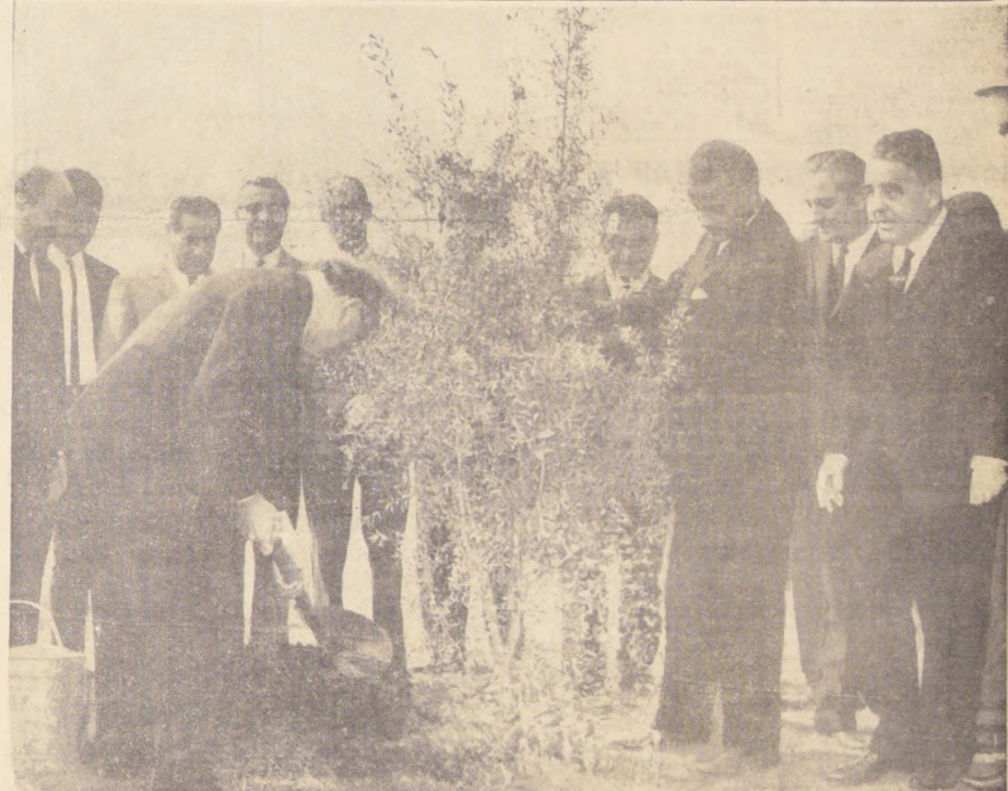
El Ministro de Agricultura de Israel, Jaim Gvati, se sumó ayer, simbólicamente, a la Campaña Nacional de Reforestación del Gobierno de Chile, plantando un maitén en el Estadio Israelita, de Las Condes. EN EL GRABADO, a la izquierda, el Secretario de Estado visitante, pala en mano, en plena tarea de "afirmar"