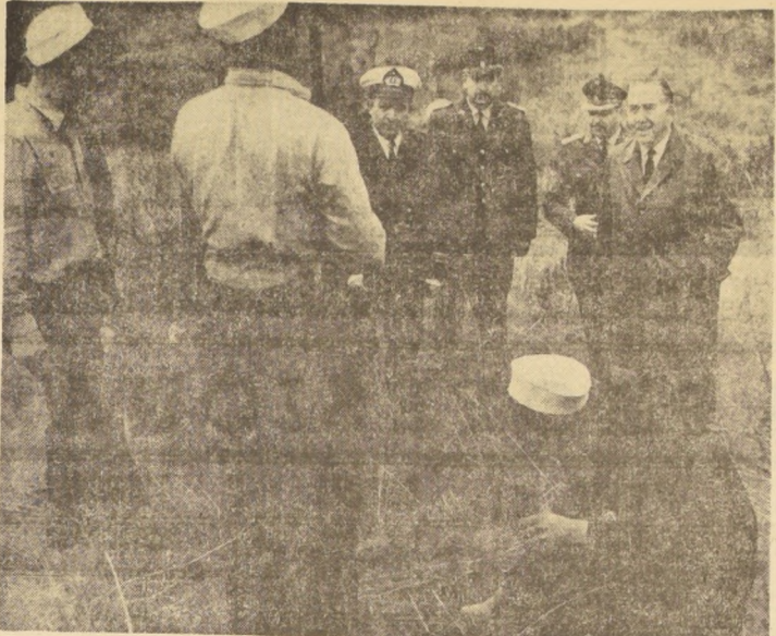
En el Parque Peñuelas se ha iniciado un gigantesco plan de reforestación. Colabora en forma especial la Armada Nacional con 50 hombres que tienen la misión de plantar un millón de arbolitos...