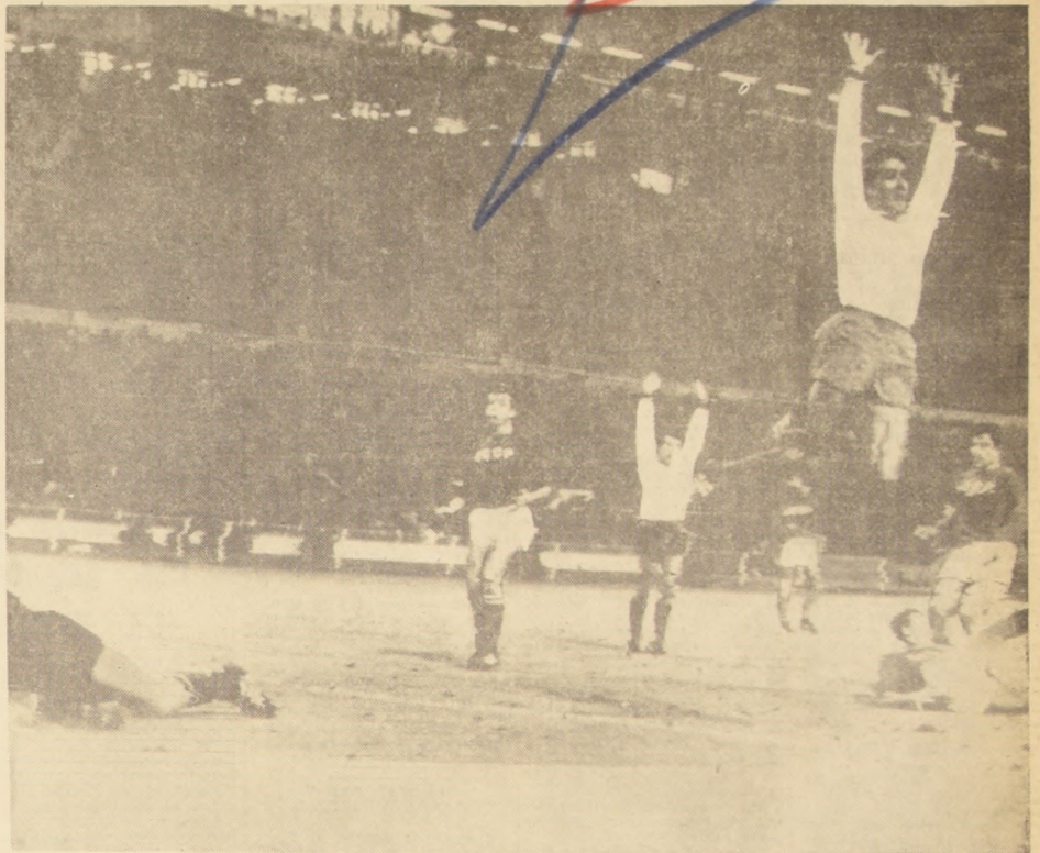
WEMBLEY (Inglaterra).— Mientras el arquero Yashin, del equipo ruso, yace en el suelo, los integrantes del Seleccionado portugués celebran alborzados el segundo gol de Portugal, que fue el gol de la victoria, al otorgarles el tercer lugar en el Campeonato Mundial de 1966, al derrotar al conjunto ruso por la cuenta de dos por uno.

Con este triunfo el cuadro lusitano realiza la gran proeza de conseguir el tercer puesto en la primera (PASA A LA PAGINA 8)