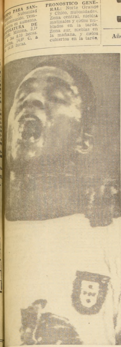
WEMBLEY, Inglaterra.— Eusebio integrante del equipo de Portugal, quien destacara notablemente en el Mundial de Fútbol, se refresca con una bebida fría, tras haber contribuido en la victoria del equipo sobre Rusia 2-1, clasificándose Portugal en el tercer lugar.

Expresó el Director Lacalle, que era inadmisibles la actitud antisocial que implicaba este tipo de infracción, ya que los sobrepuestos gravitaban por él (PASA A LA PAGINA 8)