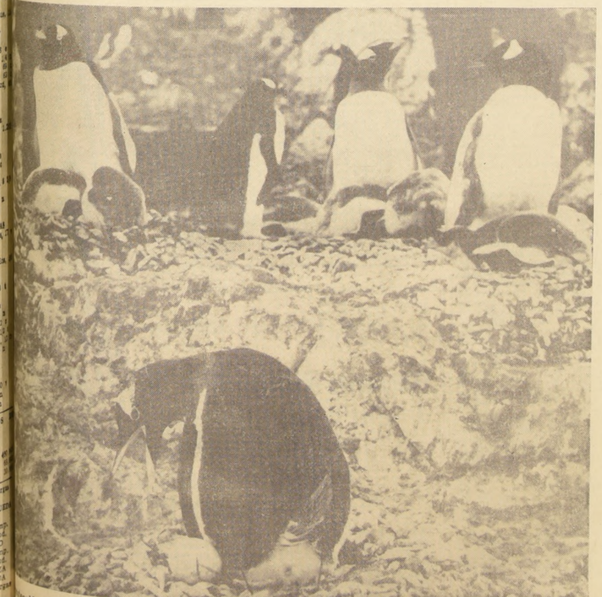
Selección de la flora y fauna antárticas propuesta por Chile será tratada en la 4.ª Reunión del Tratado Antártico. En el grabado: pinguino Adelaide empollando sus crías y huevos en la base "Gabriel González Videla".

"Coincidiendo con este Simposio", añade el señor Pinochet, "por primera vez se realizará una Exposición Antártica. Esta se exhibirá en los dos patios de la Casa Central de la Universidad de Chile. Invitamos a participar a esta Exposición a todos los países: Bélgica, Dinamarca, Japón, Sud-