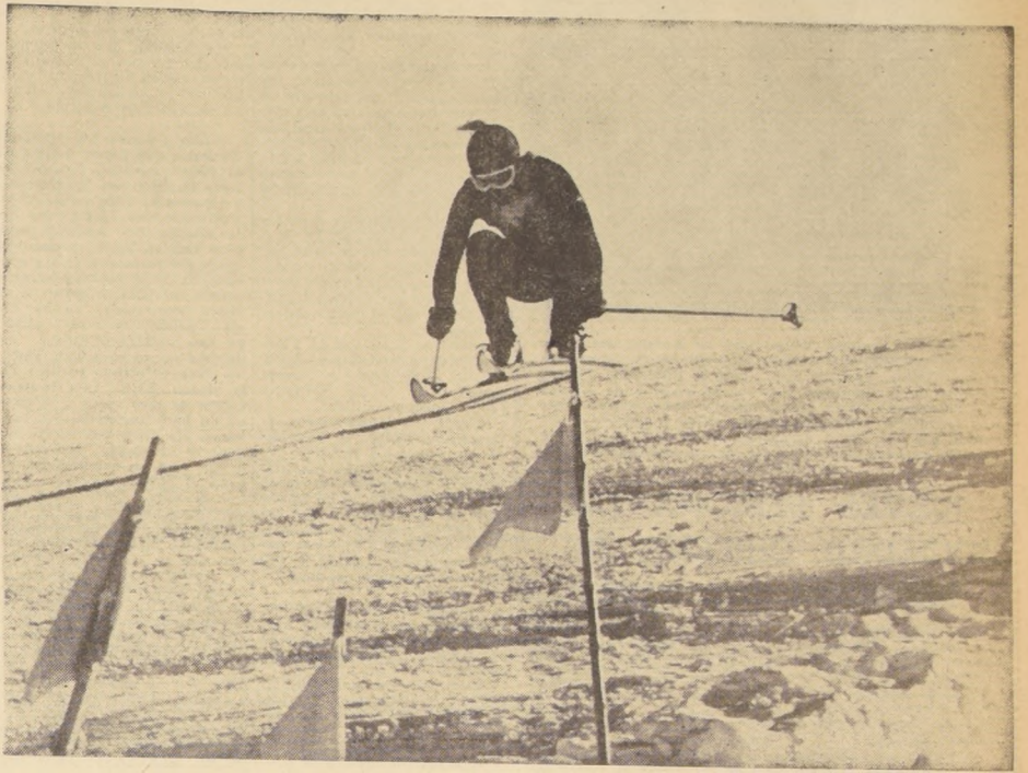
Inicia su intervención en el Descenso para Damas del Campeonato Mundial de Esquí, la austriaca Erika Schineegger, quien resultaría momentos más tarde la nueva campeona mundial de la especialidad.