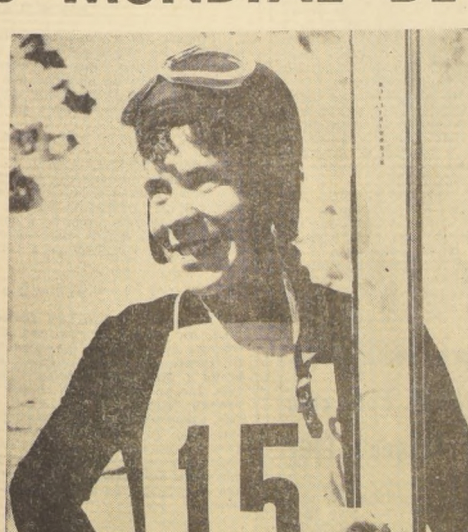
Erika Schinegger, luce su amplia sonrisa de satisfacción al posar para los reporteros gráficos luego de clasificarse Campeona Mundial de Descenso en la prueba realizada ayer exitosamente en Portillo. La esquiadora austriaca lo logró con su victoria reverdecir laureles para su delegación, luego de dos triunfos consecutivos de los franceses.