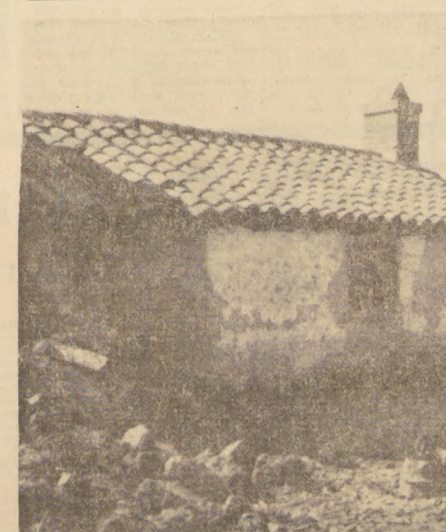
El Departamento de Cachapoal, en la provincia de O'Higgins, se caracteriza por el vigoroso impulso que se le ha dado al mejoramiento del nivel de vida de los campesinos. Los propietarios de fundos, por una parte, y la Corporación de la Reforma Agraria, por otra, han logrado que los trabajadores del agro disfruten hoy de viviendas que difieren diametralmente con las que poseían con anterioridad. En el grabado de Ramón Silva, observamos el contraste de esta aseveración en el "asentamiento" de CORA, en la comuna de Peumo.

Los obreros y empleados comprenden que la obtención de reajustes de sueldos y salarios que excedan los límites fijados por el Gobierno y que creen presiones sobre los precios, no tan sólo no los favorece, sino que los daña gravemente. c) En cuanto al Presupuesto, el Gobierno es categórico en afirmar que limitará drásticamente el crecimiento del gasto público y desea ya anunciar que se reducirán los totales autorizados para el año 1966 en la suma de 240 millones de escudos. "No cumplir las normas señaladas crea fuertes presiones (PASA A LA PAGINA 5)