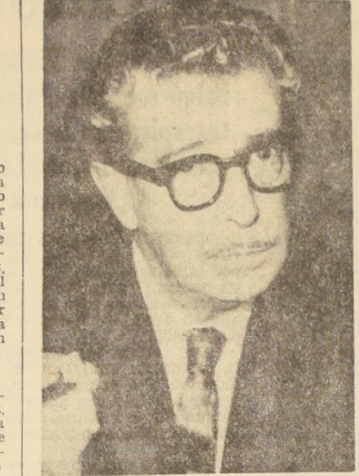
HUMBERTO ENRIQUEZ, presidente del Partido Radical.

DIPUTADOS RADICALES DEJARON DE LADO SU PROBLEMA.— MANUEL RIOSECO FORMULA CRITICAS AL PROCEDIMIENTO DEL RADICALISMO.— SENADOR HUMBERTO ENRIQUEZ DEJA LAS COSAS EN SU LUGAR.