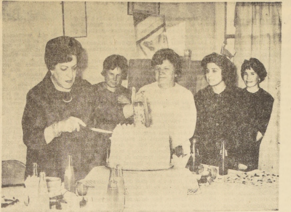
La Primera Dama de la República, señora Azúa Ruiz Tagle de Frei, asistió ayer a la significativa celebración del segundo aniversario del Centro de Madres "Irene Frei", de la población Quinta Bella, en El Salto...