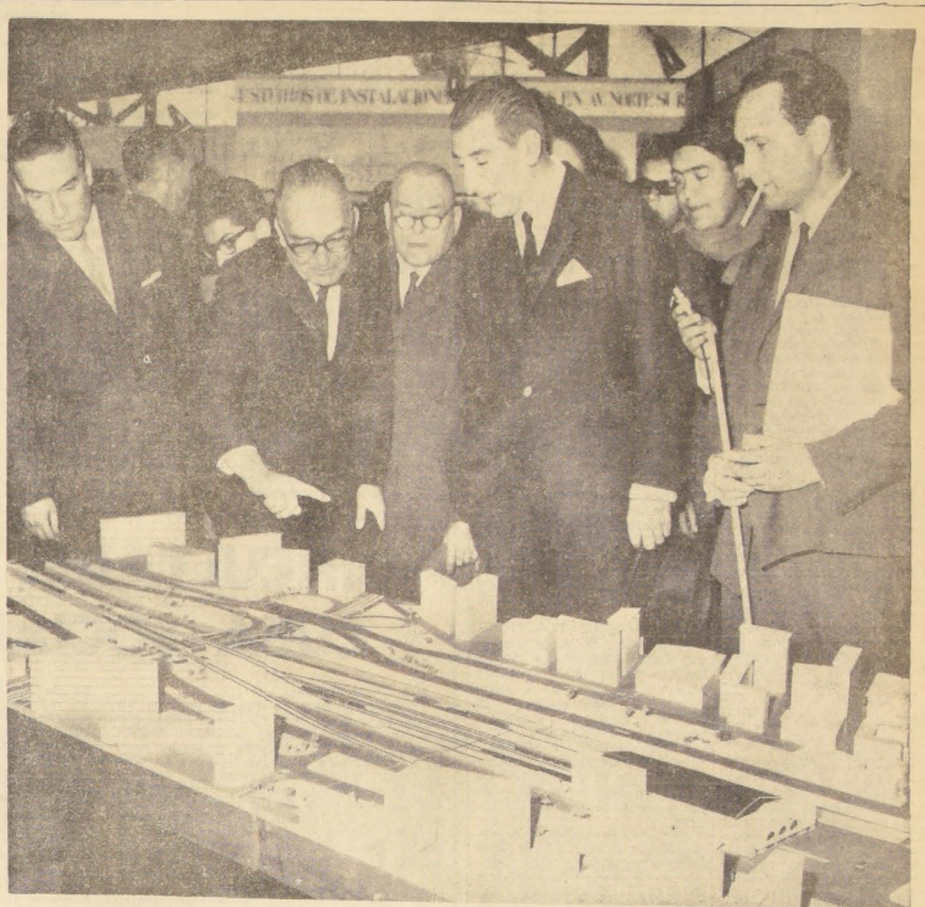
El Presidente Frei escucha las explicaciones que sobre la maqueta del Metropolitano le entrega el Ministro de Obras Públicas, Edmundo Pérez Zujovic, en el acto inaugural de la Exposición sobre la ruta Norte-Sur efectuada ayer, al mediodía.

En un comunicado dado esta noche, el Ministro de Ejército calificó de "noticia falsa" esa información. Agregó que su origen puede deberse a la explosión que ocurrió el viernes de una estufa de alcohol y que hirió seriamente a dos personas, ocurrida en un atolón situado 90 millas al noreste del lugar de pruebas de Mururoa.