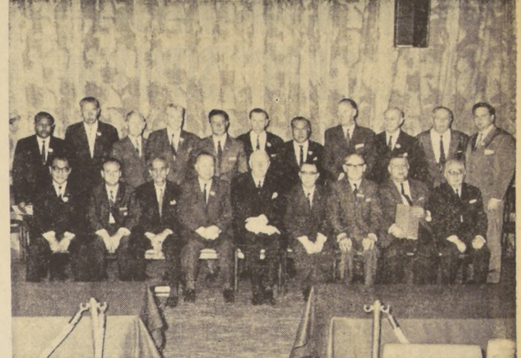
Integrantes del nuevo Comité Ejecutivo de la FIFA, que entró en funciones el 9 de julio de 1966. Salvo el presidente a quien elige el Congreso de la FIFA, todos los miembros restantes son designados por las Confederaciones y Agrupaciones Geográficas que señala el artículo 18 del Estatuto.