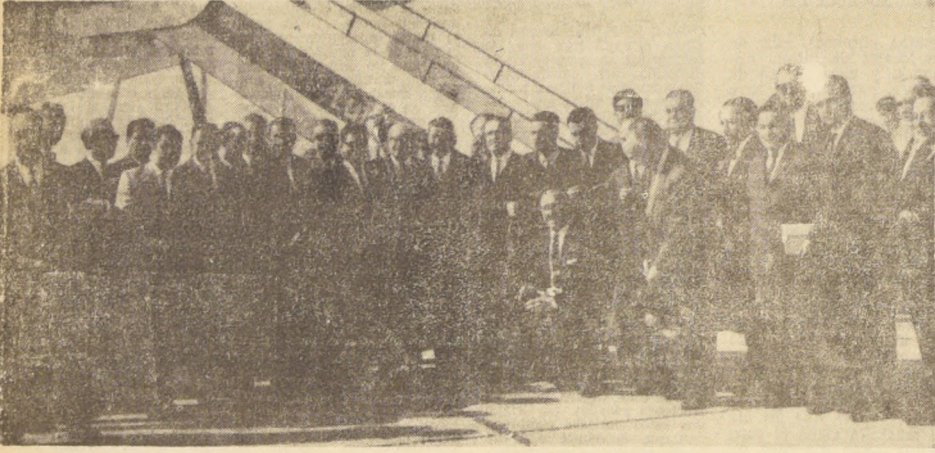
Vinticinco alcaldes chilenos viajan a Berlín Occidental, invitados por el Gobierno de la República Federal de Alemania. Participarán en un seminario de estudio sobre sistemas y problemas de la administración comunal...