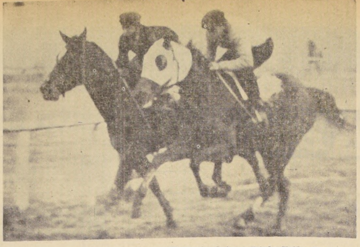
Templario, correrá en el "Juan Antonio Ríos" antes de irse a Estados Unidos. En el grabado, apronta con otro ejemplar en la pista del Hipódromo Chile.