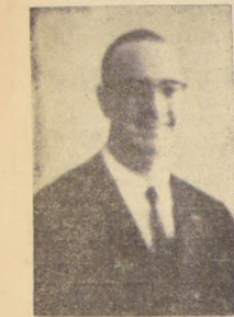
El Dr. Abraham Horowitz

ternacional dedicado a promover la salud más antigua del mundo, pues fue fundado el 2 de diciembre de 1902, cuando en el mundo no se vislumbraba siquiera la creación de entidades multinacionales, como lo fueron las agencias creadas por la Liga de las Naciones, después de la I Guerra Mundial, y por las Naciones Unidas, después de la II.