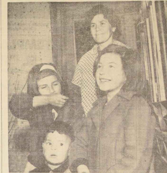
Una debida protección a las necesidades de la familia chilena establece el proyecto de reforma a la previsión social, en su parte referente a las llamadas "Prestaciones Familiares", que tienden a satisfacer, a través de una distribución más justa de los beneficios previsionales, las aspiraciones del núcleo familiar.