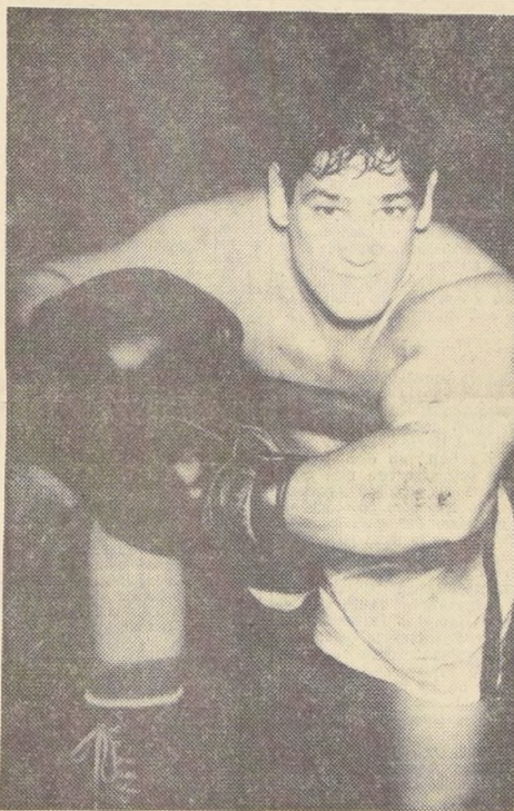
Oscar "Ringo" Bonavena, el popular peso máximo, que esta noche se juega brava chance ante el promisorio norteamericano Frazier, en sus aspiraciones de disputar el cetro de los pesados con el discutido Cassius Clay.

El primer combate como finalista en el Madison Square Garden, Frazier sólo ha superado a tres pesados más o menos conocidos: Mel Turnbow, Chuck Leslie y Billy Daniels.