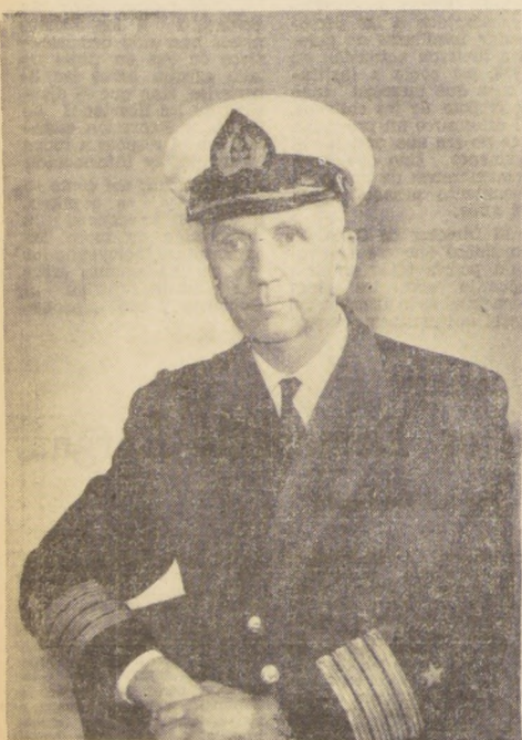
La Superioridad de la Armada designó como Comodoro de la Vigésimoprimer flota que realizará la Expedición Antártica del presente año al capitán de navío Arturo Riecke Schwertner, quien desempeñaba hasta el momento de su nombramiento, la Dirección del Instituto Hidrográfico de la Armada. En el grabado, el Comodoro Arturo Riecke.