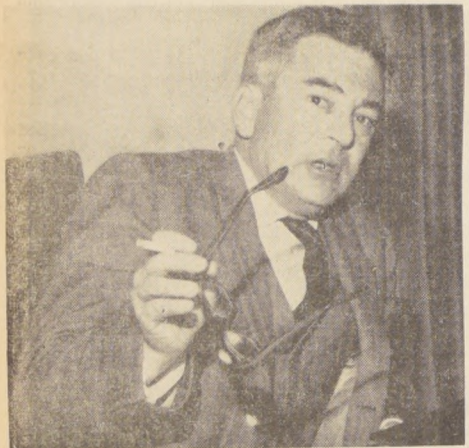
El Subsecretario de Economía, Arturo Montes, informó en conferencia de prensa efectuada ayer sobre los estudios y conclusiones de esta Comisión. EN EL GRABADO, el Subsecretario de Economía, Arturo Montes.

Otros campings están siendo organizados en la zona del Norte Verde, estimándose que durante el transcurso del