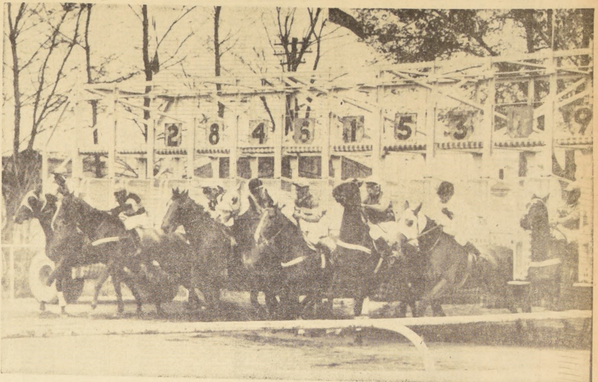
Los competidores del clásico "Jockey Club de Mendoza" en los momentos de la largada. Se puede apreciar perfectamente la gran diferencia entre los jinetes chilenos y argentinos para partir. De izquierda a derecha: (1) Don Tufi, (2) Templario, (3) Tundueque, (5) Analyst, (1) Incendio, (6) Gen-