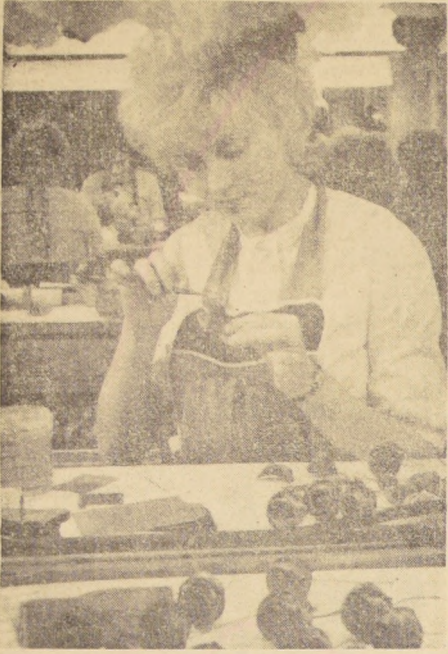
En contraste con las jóvenes inquietas que ahora gustan hacer hablar de ellas, no son pocas las muchachas que prefieren dedicarse a las tareas femeninas tradicionales, como esta bella artífice de flores plásticas.

El astro femenino que en estos momentos asciende al céntro de la popularidad en Europa, nos sorprende desde el borde de una piscina, como