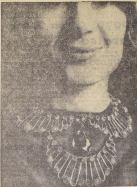
S. F. I. — "CINNA" original collar. Creación CIS, mención obligatoria.