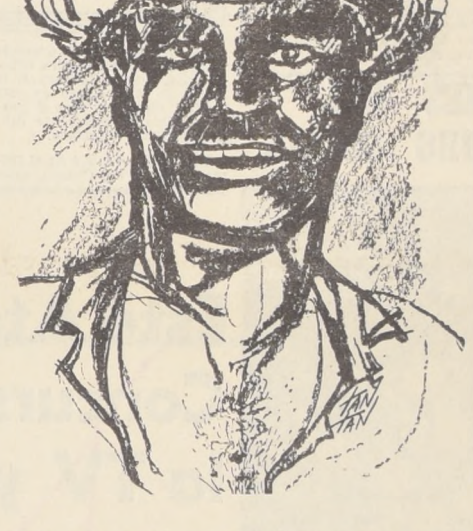
El Roto Chileno, hijo genuino del pueblo, y crisol del más puro patriotismo, recibirá hoy un homenaje en el monumento, obra del escultor Virgino Arias, que se alza en la Plaza Yungay.

El acto inaugural del Monumento al Roto Chileno, obra del escultor Virgino Arias, fue una ceremonia impresionante. La Banda de Guerra del Regimiento de Granaderos ejecutó el Himno Patrio y luego la Canción de Yungay. Ambas, coreadas con honda emoción por los escolares, autoridades y público asistente.