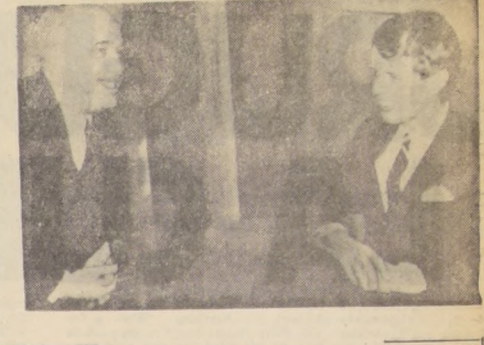
1.— ROMA, ITALIA; El senador norteamericano, Robert Kennedy, quien finaliza en Italia su gira para pulsar la opinión europea, aparece durante la entrevista que por una hora sostuvo con el Ministro de Relaciones de Italia, Amintore Fanfani, ayer, Kennedy regresó hoy a los Estados Unidos después de entrevistarse con el Sumo Pontífice.