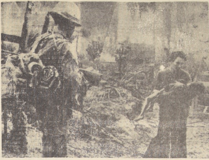
SAIGON.— El humo sirve de telón de fondo en esta aldea incendiada del Vietnam del Sur. Un padre acusa a su hijo muerto, mientras la guerra continúa. La escena fue captada en una aldea cerca de Ton Son, en la parte norte del Vietnam del Sur.