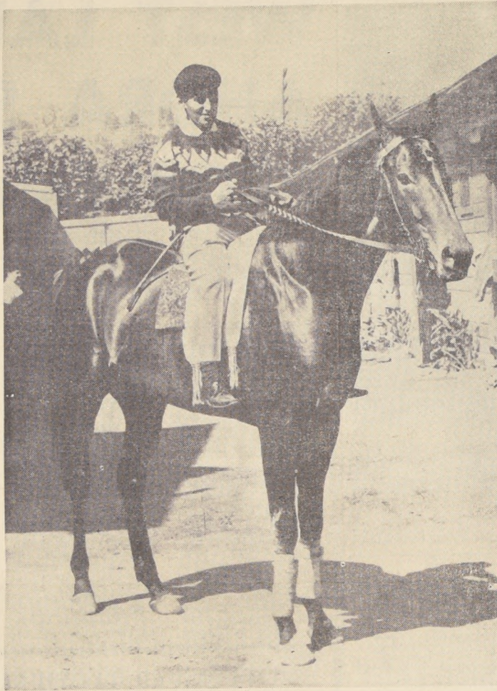
MONTECASINO, uno de los favoritos del Premio THOMPSON MATTHEW que se correrá mañana en el Valparaíso Sporting Club.

HIPODROMO CHILE 12ª CARRERA - MERLUPO (E. Guzmán) 700 en 44.35 2ª CARRERA - BAVIERA (H. Obregón) 1.000 en 1.05 3ª CARRERA - SIDARTE (B. Garcia) 400 en 22.25 5ª CARRERA - TORONTITO (S. Pradenas) 400 en 22.35 6ª CARRERA - PROTEO (M. Ramirez) 1.200 en 1.21 7ª CARRERA - EMPENO (P. Ulloa) 500 en 33.25 8ª CARRERA - URANIA (P. Ulloa) 600 en 38 vienes 9ª CARRERA - YASA (aprendiz) 1.200 en 1.20 10ª CARRERA - CAPITANO (P. Ulloa) 600 en 36.25 11ª CARRERA - DON TAVI (M. Flores) 500 en 52.15 12ª CARRERA - MERLUPO (E. Guzmán) 700 en 44.35