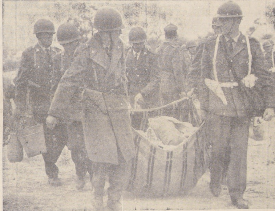
De acuerdo con un estudiado plan de agitación, dirigentes socialistas y comunistas lograron que un grupo de personas sin casa ocupara, en la madrugada de ayer, terrenos en el sector Lo Prado, en la comuna de Barrancas, en los que se iba a efectuar una Operación Sitio para beneficiar a 2.500 familias que carecen de viviendas. En el grabado de arriba puede verse a los ocupantes tomando posesión de los terrenos, haciendo ostentación de banderas chilenas, todas del mismo tamaño, que les fueron entregadas por los organizadores de la ocupación; y, abajo, a Carabineros retirando con todo cuidado, sin violencia alguna, las especies que los ocupantes habían llevado a los terrenos.