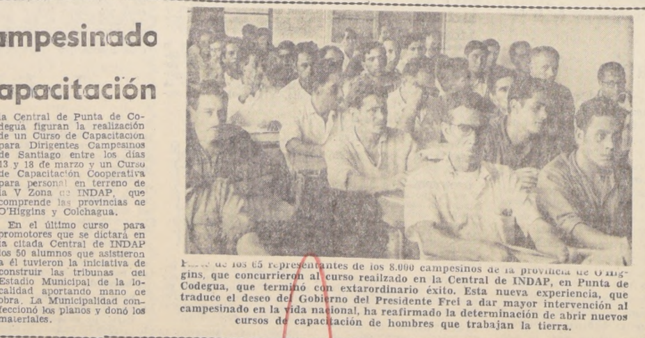
Entre los 55 representantes de los 8.000 campesinos de la provincia de O'Higgins, que concurrieron al curso realizado en la Central de INDAP, en Punta de Codelgua, que terminó con extarordinario éxito. Esta nueva experiencia, que traduce el deseo del Gobierno del Presidente Frei de dar mayor intervención al campesinado en la vida nacional, ha reafirmado la determinación de abrir nuevos cursos de capacitación de hombres que trabajan la tierra.

En el último curso para promotores que se dictará en la ciudad Central de INDAP los 50 alumnos que asistieron a él tuvieron la iniciativa de construir las tribunas del Estadio Municipal de la localidad aportando mano de obra. La Municipalidad conectó los planos y donó los materiales.