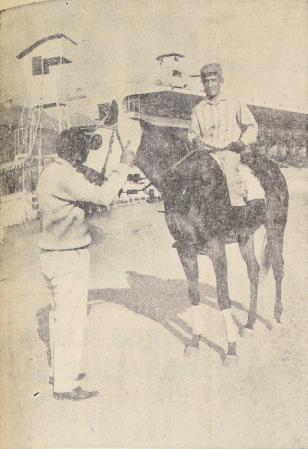
LA MEJOR POTRANCA de dos años que se ha visto hasta el momento en Chile...