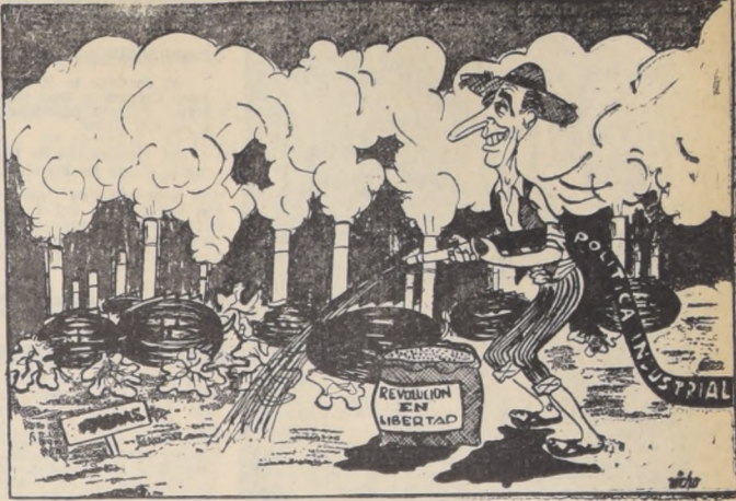
parece que esta tierra, la hemos abonado bien