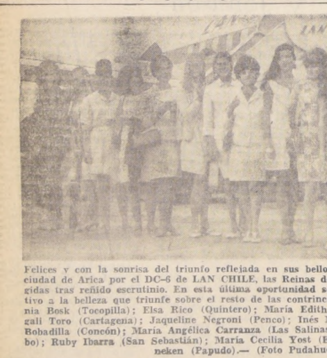
Felices y con la sonrisa del triunfo reflejada en sus bellos rostros, se dirigieron a la ciudad de Arica por el DC-6 de LAN CHILE, las Reinas de las Playas que fueron elegidas tras riguroso escrutinio. En esta última oportunidad se concederá el título definitivo a la belleza que triunfa sobre el resto de las contrincantes.

Una extensa y enérgica batida a los establecimientos que clandestinamente están elaborando dulces, pastillas, calugas y masticables, está dando en Santiago la Oficina de Control de Alimentos, del Servicio Nacional de Salud, que comanda el doctor Moisés Solorza Campos. Esta medida de fiscalización se ha agudizado ostensiblemente, en los últimos días, frente al período de actividad escolar que se ha iniciado. Las razones que argumentan los inspectores de la repartición es que los estudiantes son los que sufren con mayor impacto la crueldad de la irresponsabilidad de estos fabricantes clandestinos. En sólo una semana de profunda labor, el personal inspectivo de la Oficina de Control de Alimentos, visitando sorprendentemente diversos locales, ha logrado decomisar productos por un valor superior a los $ 50.000.