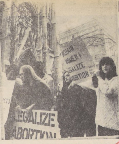
Una original manifestación de muchachas que exigían la reforma de las leyes de Nueva York que no permiten el aborto...

A continuación, dijo que él y Holmberg descubrieron la posibilidad de reducir la condensa de una explosión nuclear, mediante procedimientos químicos.