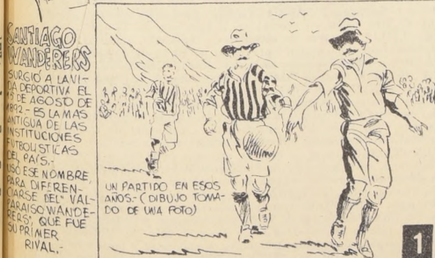
LA MAYORIA DE LOS JUGADORES ERAN VECINOS DE LA PLAZA BARRAQUEN, DEL BARRIO ADUANA, DE LA SUBIDA ARTILLERIA Y DEL BARRIO PLATA ANCHA...