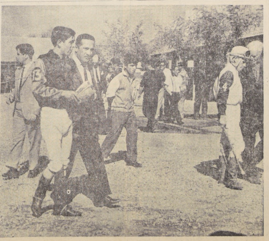
Mucha gente en el paddock palmeño. Hay serios estudios para limitar la entrada de personas ajenas al rodaje de una reunión hípica.

(ALVARO BREQUE en conversación con LA NACION.)